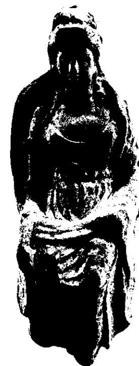
Neg. 10743 X

PROVINCIA E COMUNE: TA - Taranto LUOGO DI COLLOCAZIONE: Museo Nazionale INV. 100284 OGGETTO: Statuetta raff.: figura femminile in trono PROVENIENZA (rif. I.G.M.): Taranto (F 202 NO) DATI DI SCAVO: 23/10.1954 Via Dante INV. DI SCAVO: (o altra acquisizione) tra le Vie Capocelatro e Giusti - Pozzo n.1 DATAZIONE: fine IV sec. a.C. ATTRIBUZIONE: Fabbrica locale (?) MATERIALE E TECNICA: Argilla di colore avana scuro, micacea, depurata. MISURE: Alt.max 14,4; larg.8,3 STATO DI CONSERVAZIONE: Lacunosa nella parte inferiore; legger- mente incrostata e scheggiata in qualche punto. CONSISTENZA ATTUALE DEL MATERIALE: - ESAME DEI REPERTI: - CONDIZIONE GIURIDICA: Proprietà dello Stato NOTIFICHE: -