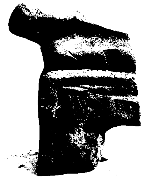
NEG. 9986 X

DESCRIZIONE: I piedi, probabilmente appartenenti a figura maschile recumbente su kline, fornita di materasso, sono avvolti in un himation. La kline ha il piede a semicolumna, aggettante da un pilastro rettangolare. L'assenza di gran parte della figura non permette la datazione del frammento anche se non ne impedisce l'interpretazione.