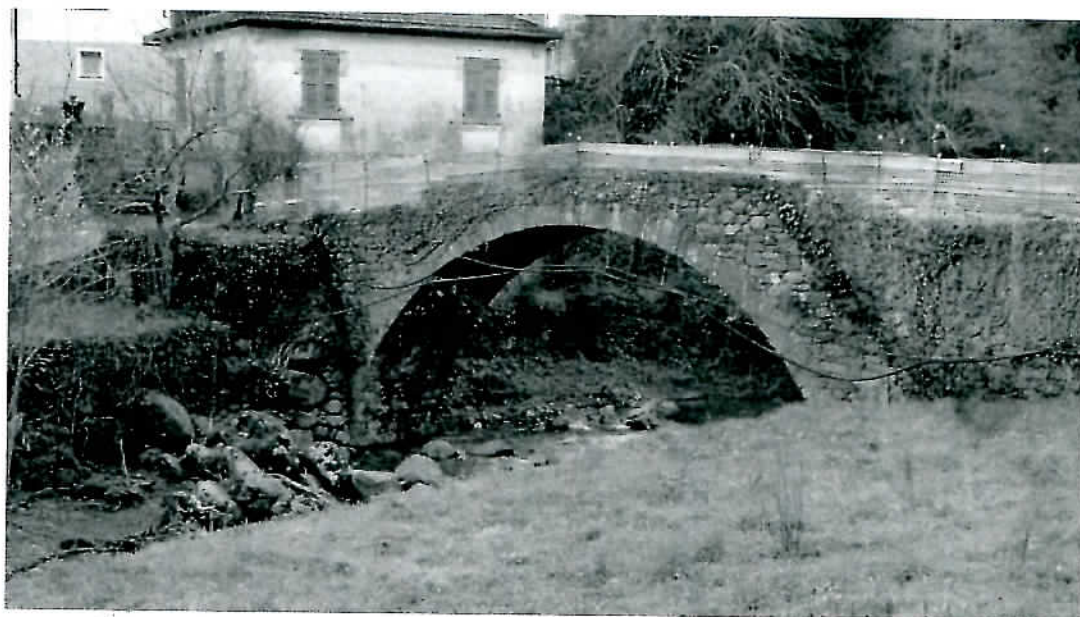
Fig.1: Il ponte di Mezzavalle.