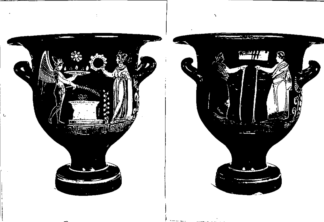
lievi Neg; 11862 X