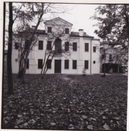
SBAA Veneto 52013