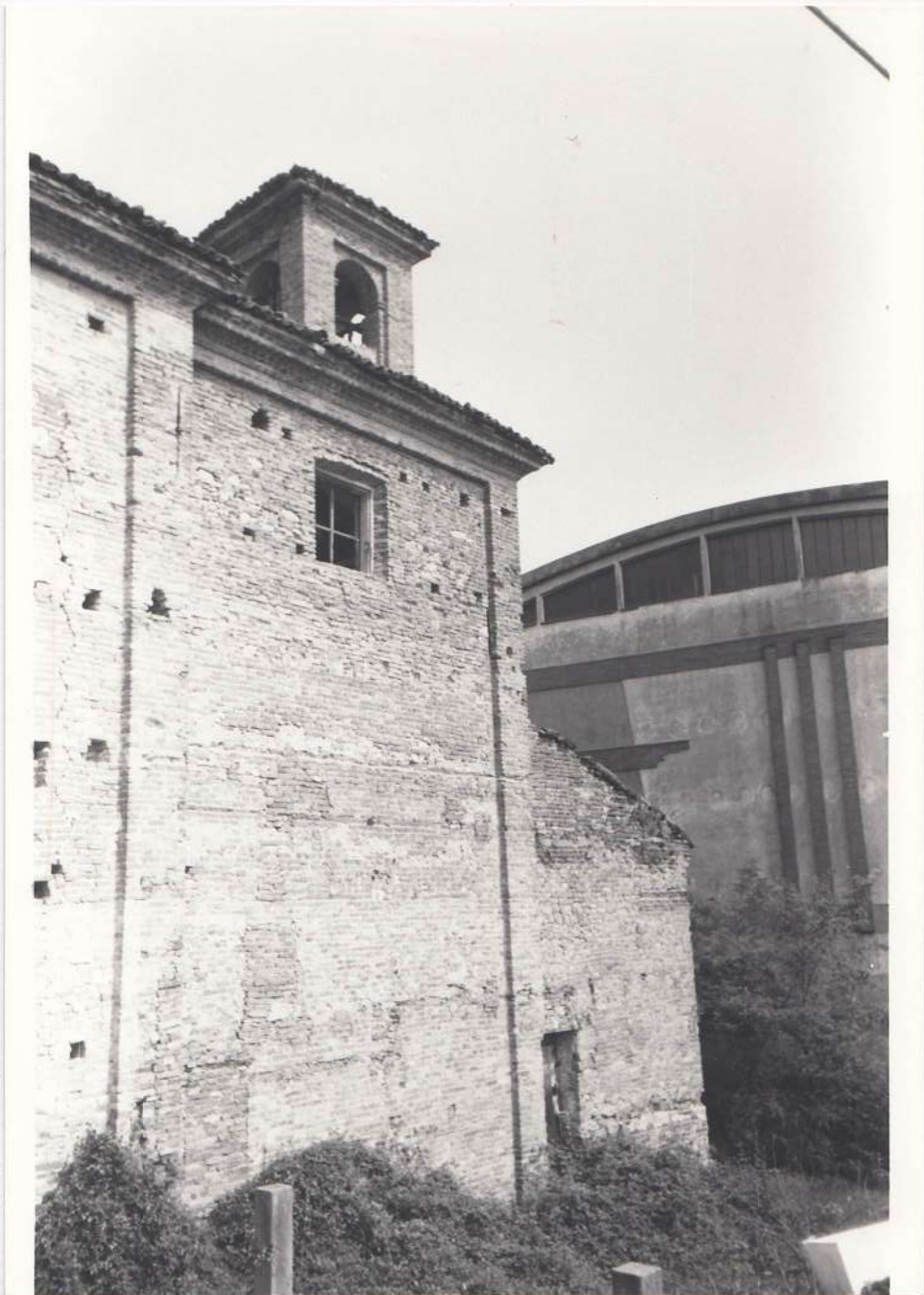
CHIESA DI S. GIOVANNI: prospetto Sud