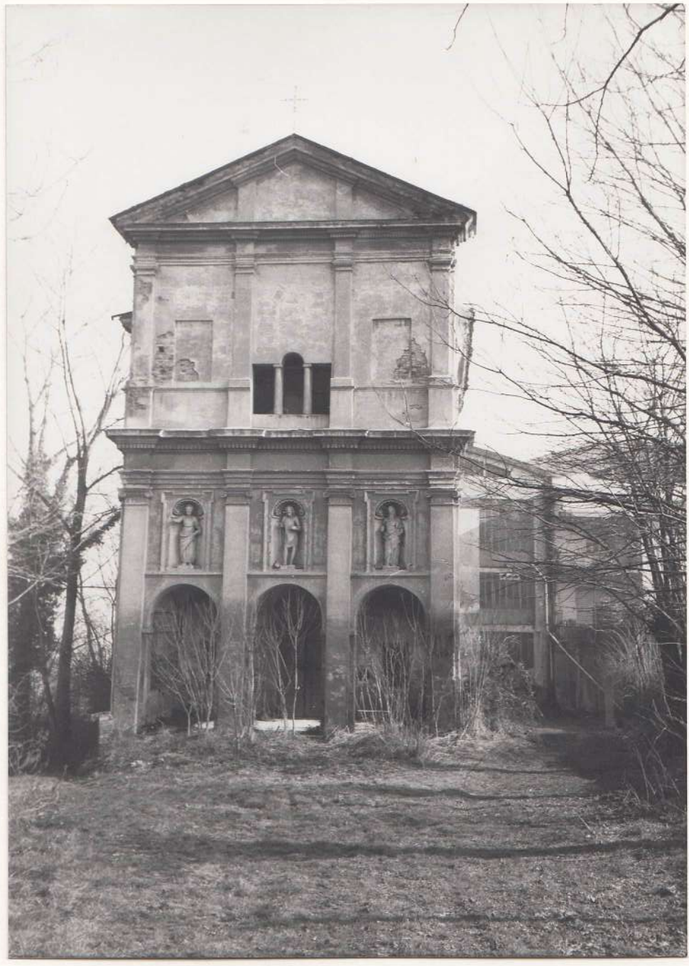
Cappella campestre di San Giovanni Battista.

(5605238) Roma, 1975 - Ist. Poligr. Stato - S. (c. 400.000)