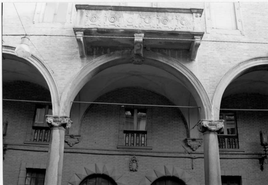
PARTICOLARE DEL PROSPETTO SU VIA CAVOUR