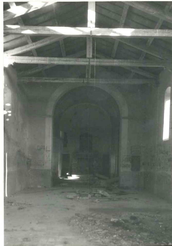
INTERNO DEL SANTUARIO