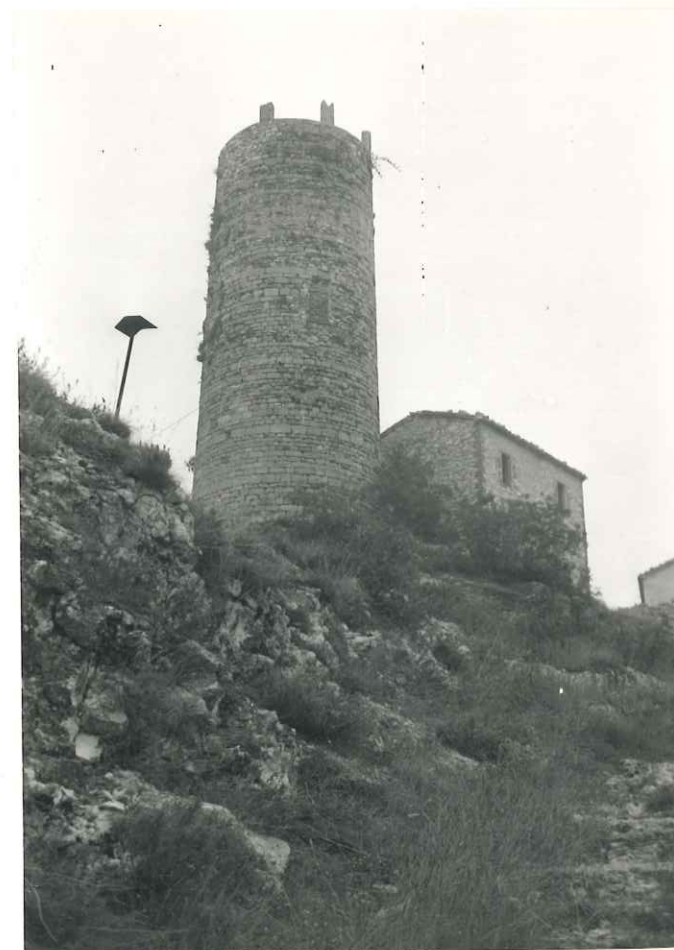
VISTA GENERALE (LATO MARECCHIA)