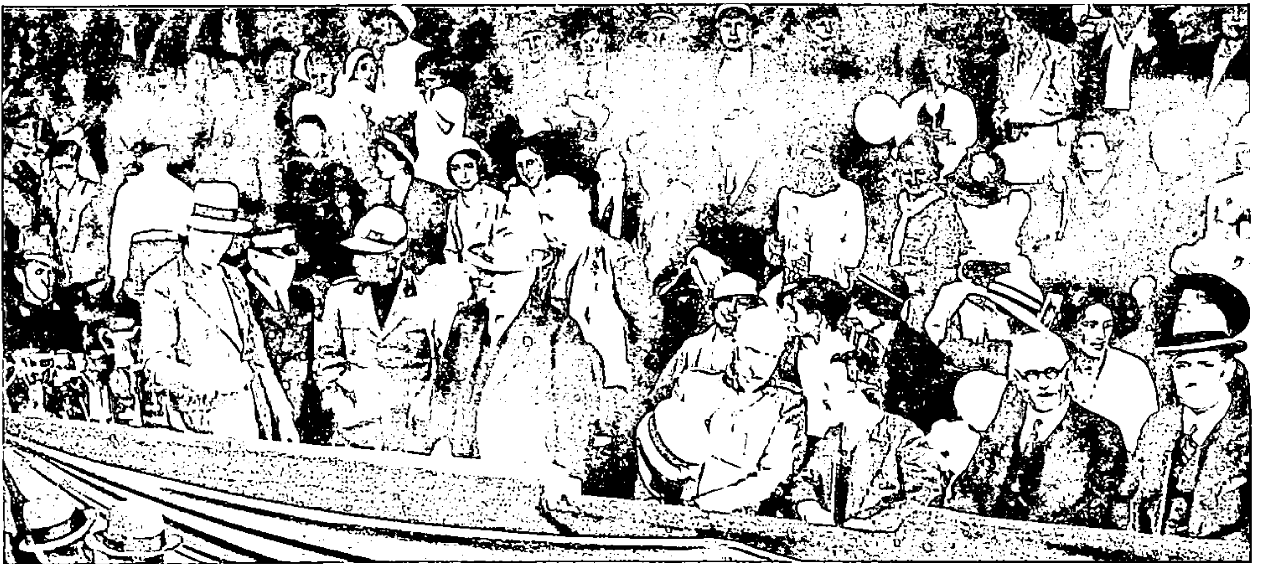
Il gruppo delle autorità nella tribuna d'onore allo Stadium comunale, durante il Saggio ginnico dell'O. N. B.