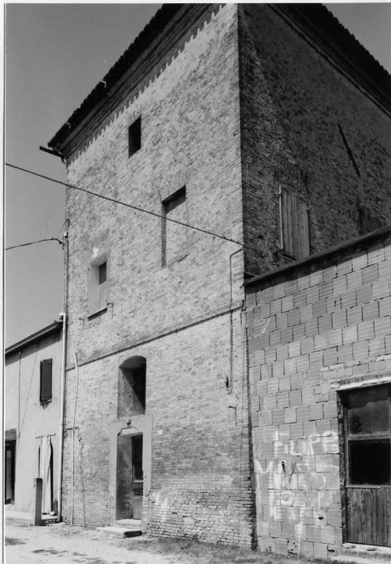
TORRE A TRE PIANI