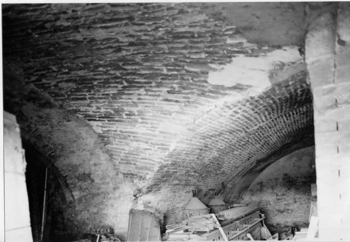
VOLTE ALL'INTERNO DEL LATO EST