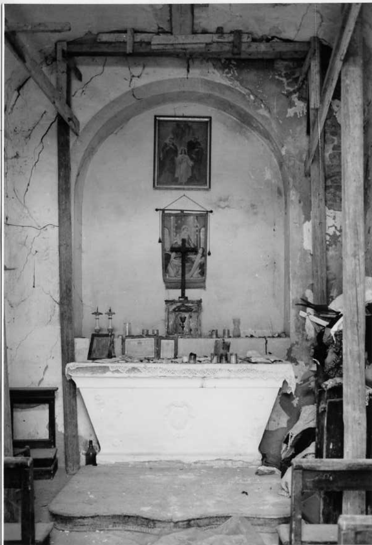
INTERNO DELLA CAPPELLA