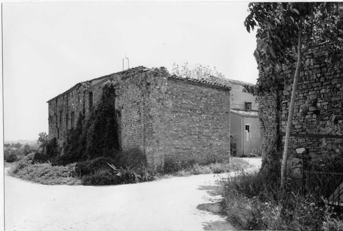
VARCO D' ACCESSO