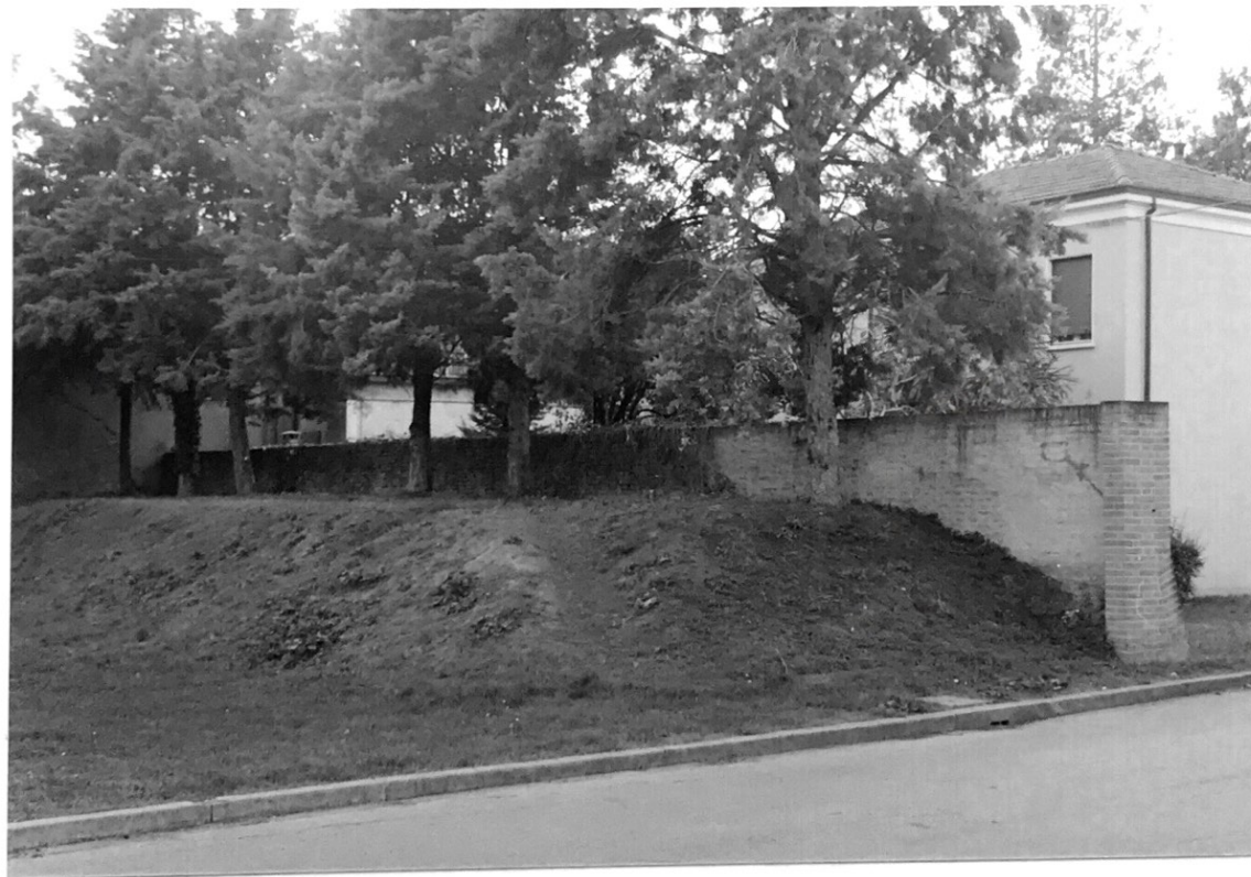
VEDUTA DA PIAZZA S. RUFFILLO