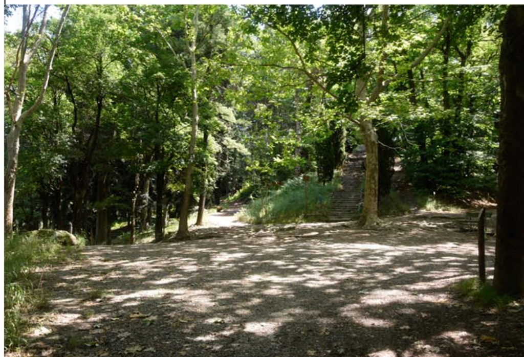
1- Piazzale Calvario. Vista d'Insieme