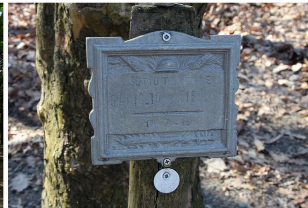
3 - Piazzale Calvario. Cippo commemorativo. Sottotenente GARIGLIO DIEGO. 18-7-15. matricola 1095