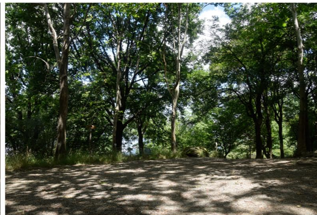
2- Piazzale Calvario. Vista d'insieme