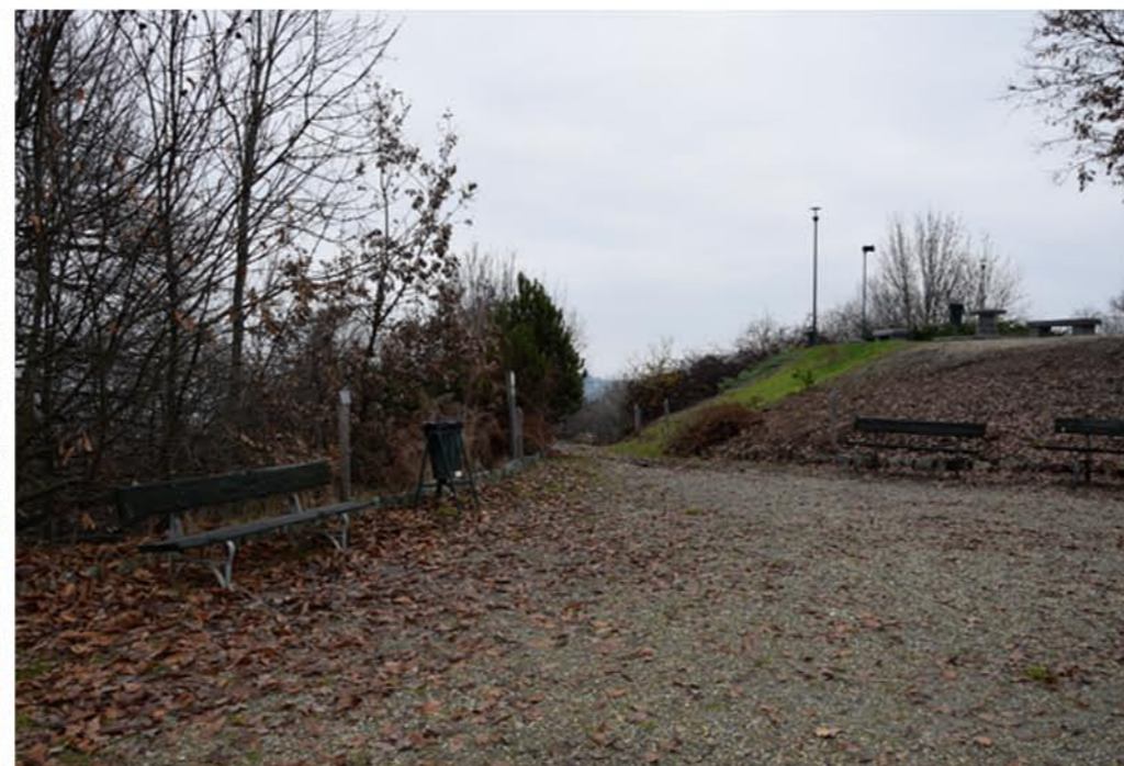
2- Piazzale Quota 144. Vista d'insieme