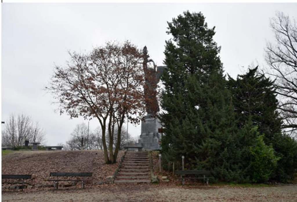
1- Piazzale Quota 144. Vista d'insieme