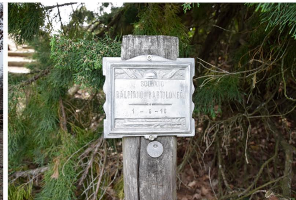
3 - Piazzale Quota 144. Cippo commemorativo. Soldato BALBIANO BARTOLOMEO. 1-6-16. matricola 3351