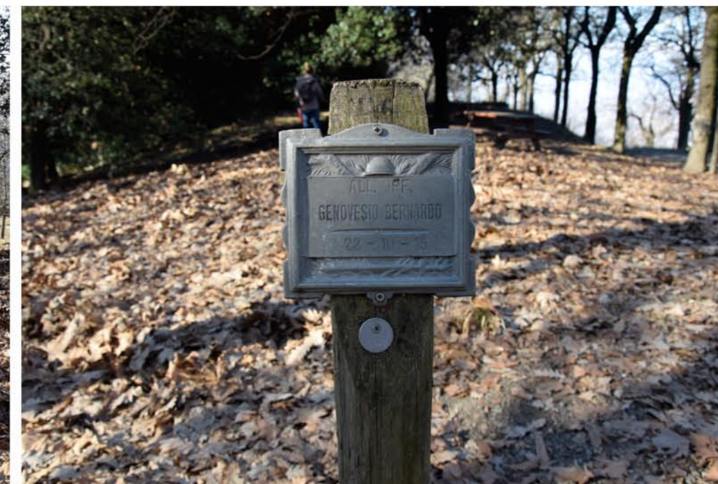
3 - Salita Macedonia. Cippo commemorativo. All. Uff. GENOVESIO BERNARDO 22-10-13. matricola 1146