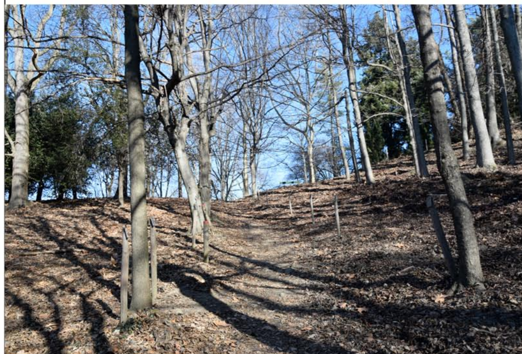
1- Salita Macedonia. Punto iniziale