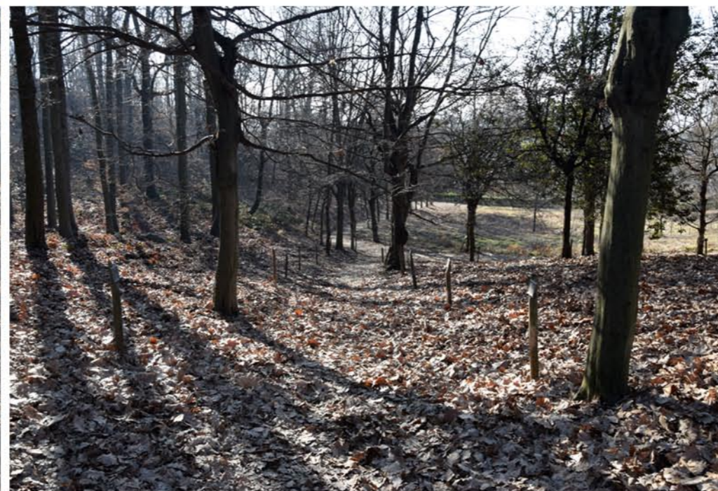
2- Salita Macedonia. Punto finale