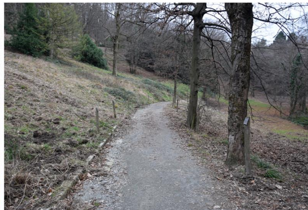
2- Viale Doberdò. Punto finale