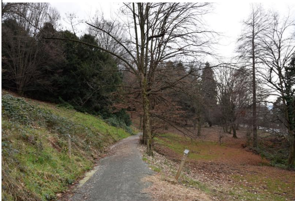
1- Viale Doberdò. Punto mediano