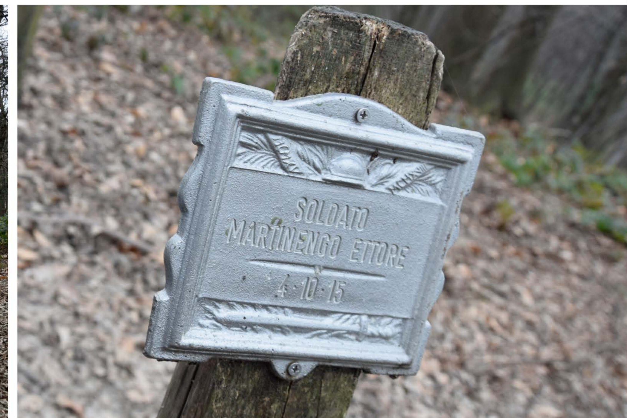
3 - Viale Oslavia. Cippo commemorativo. Soldato MARTINENGO ETTORE. 4-10-18. matricola 4423