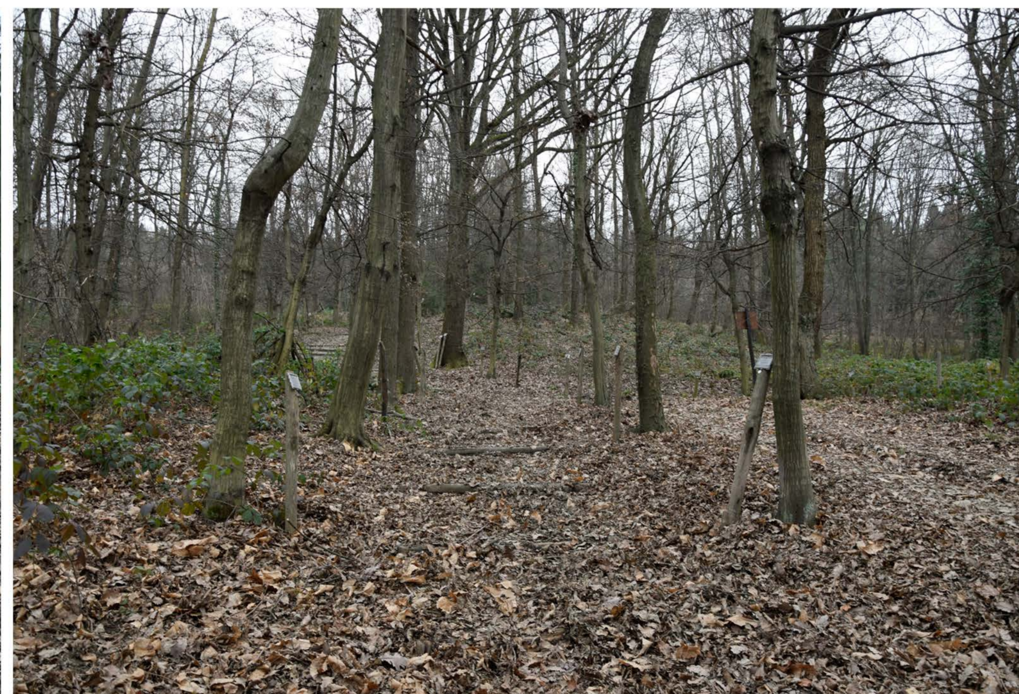
2- Viale Oslavia. Tratto finale