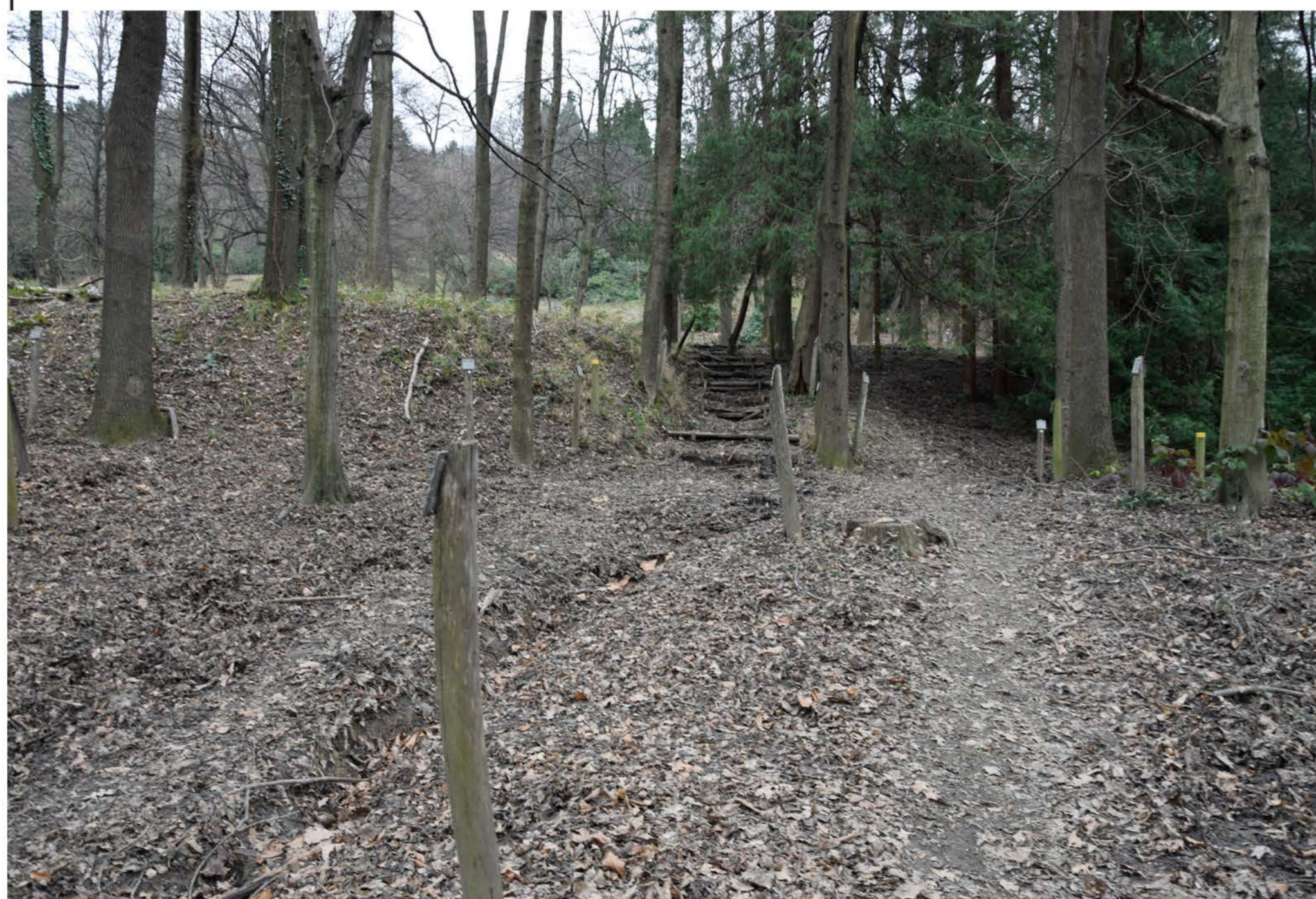
1- Viale Oslavia. Punto iniziale