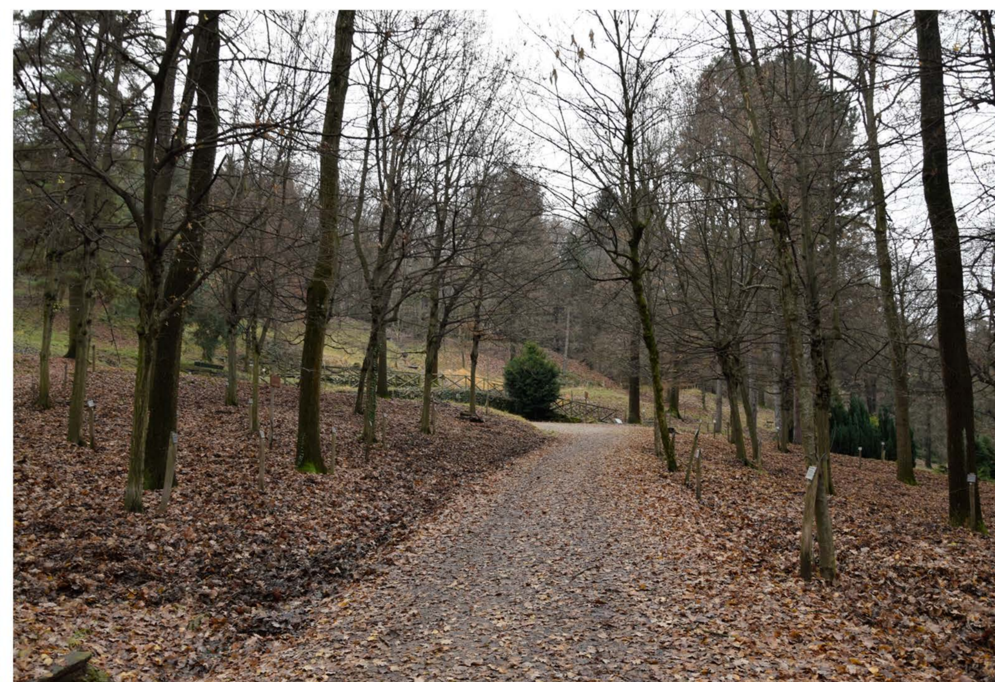
2- Viale Piave 2° tratto. Punto mediano