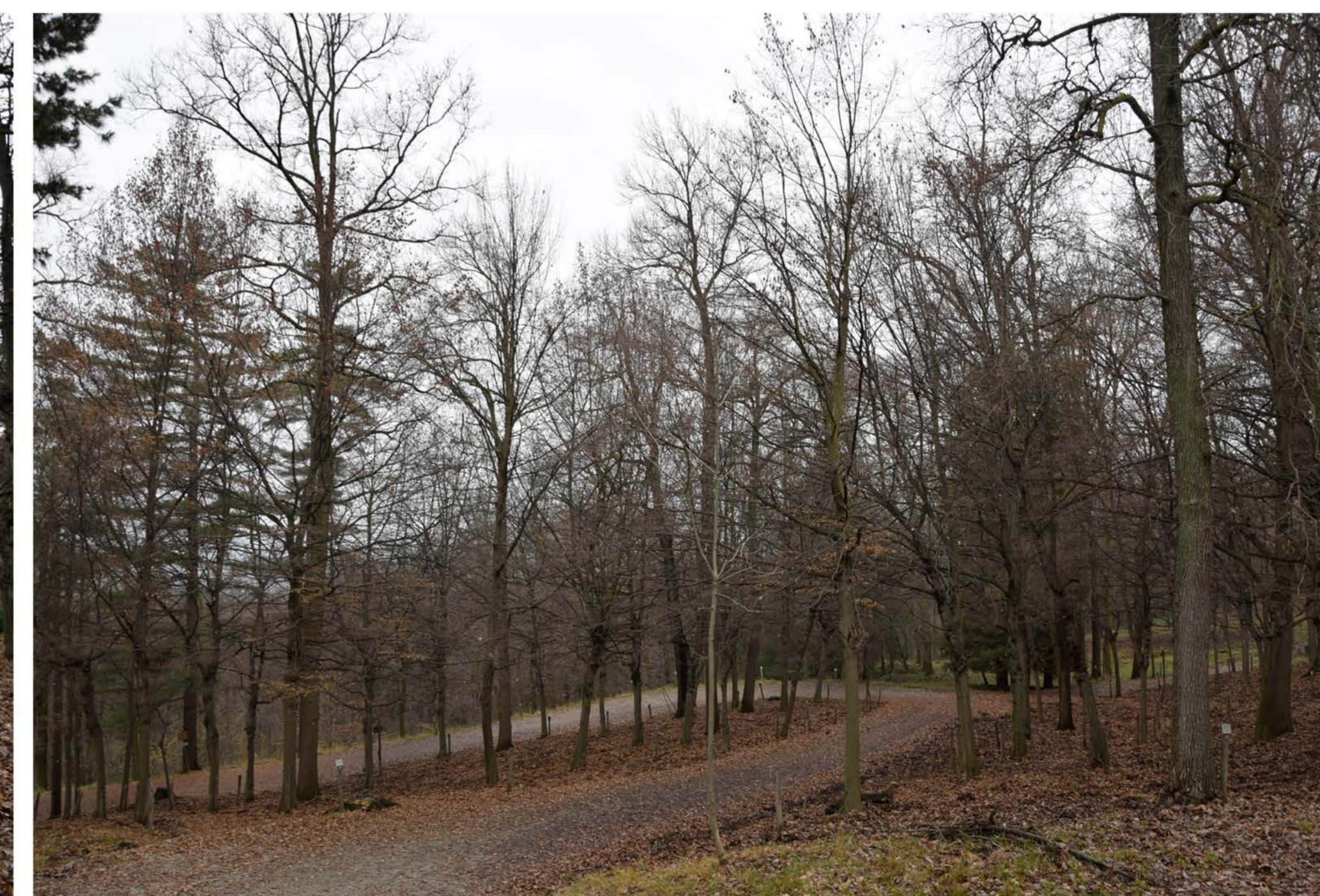
3 - Viale Piave 2° tratto. Cippi commemorativi. Vista d'insieme