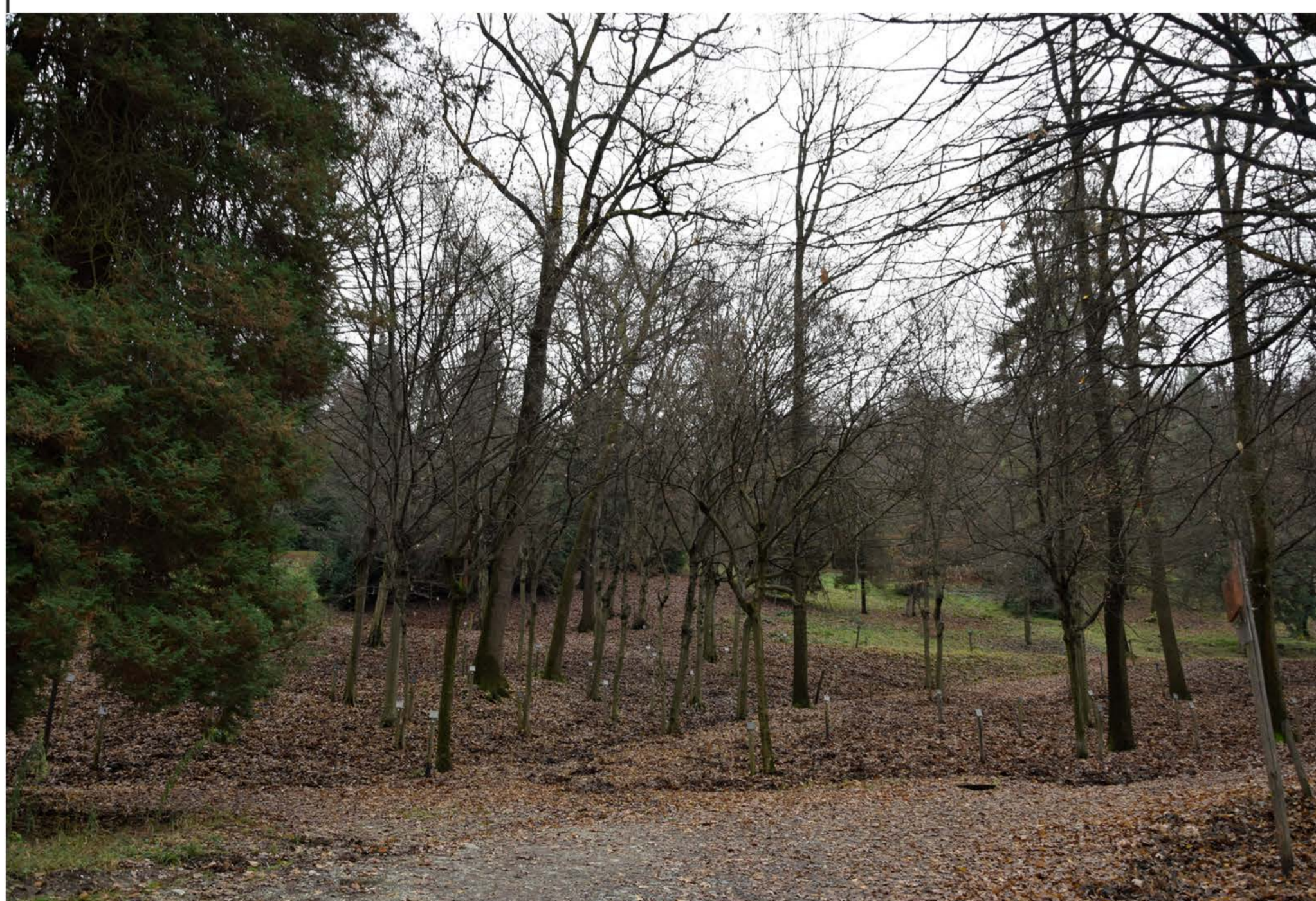
1- Viale Piave 2° tratto. Punto iniziale