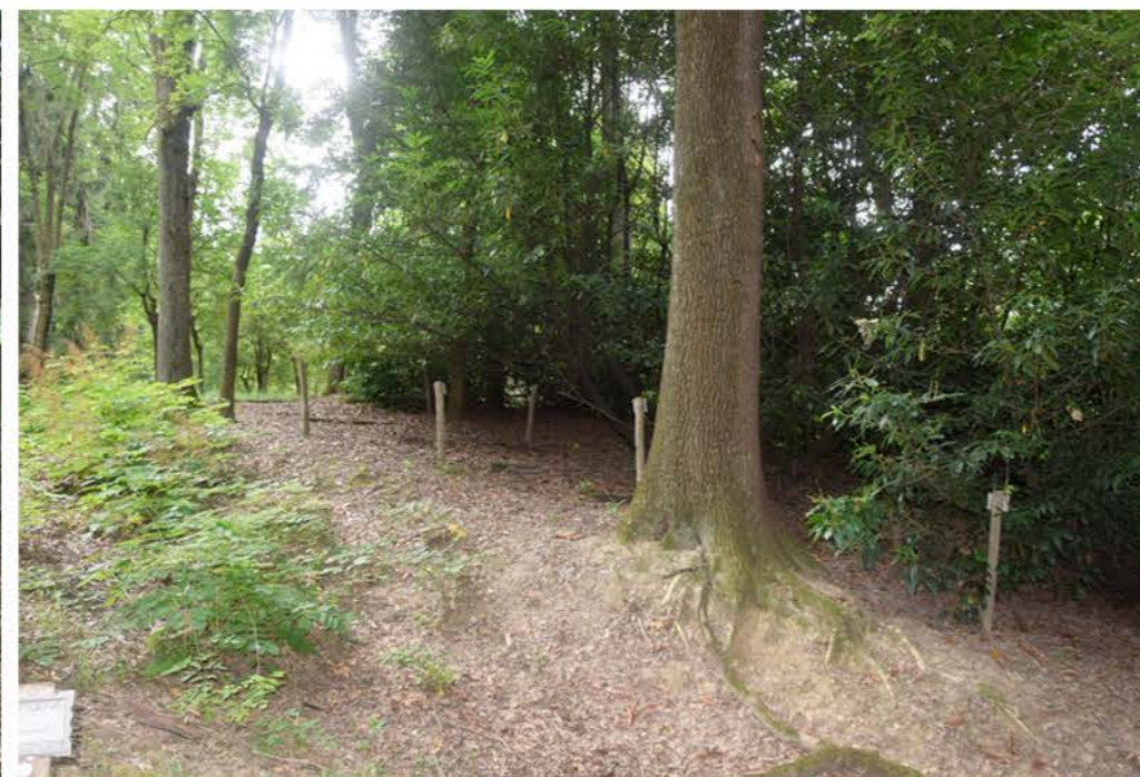
2- Viale Polazzo. Secondo tratto