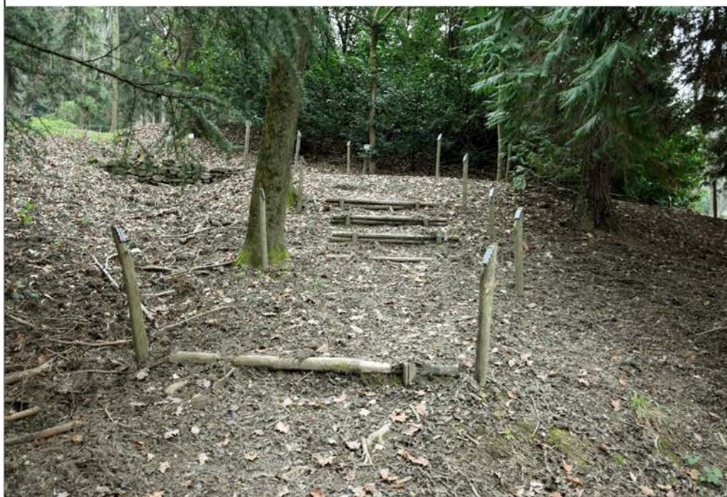
1- Viale Polazzo. Primo tratto