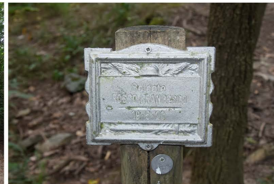
3 - Viale Polazzo. Cippo commemorativo Soldato ROSSO FRANCESCO 19-5-20. matricola 4778