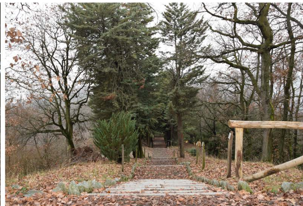
2- Viale Quota 144. Punto finale