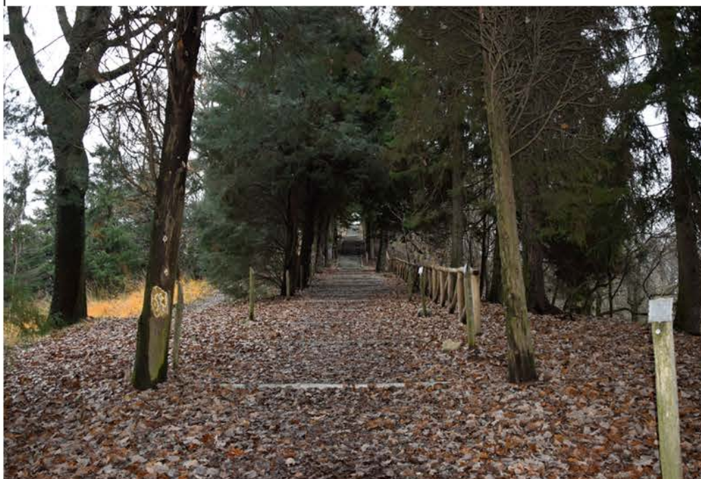
1- Viale Quota 144. Punto iniziale