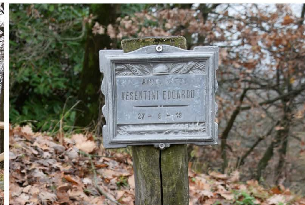
3 - Viale Quota 144. Cippo commemorativo Aiu. Batt. VISENTINI EDOARDO 27-8-18. matricola 3342