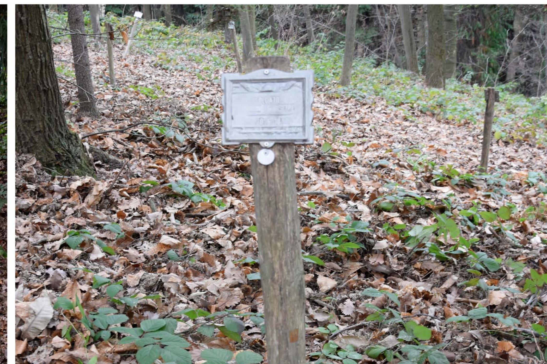
3 - Viale Sabotino. Cippo commemorativo