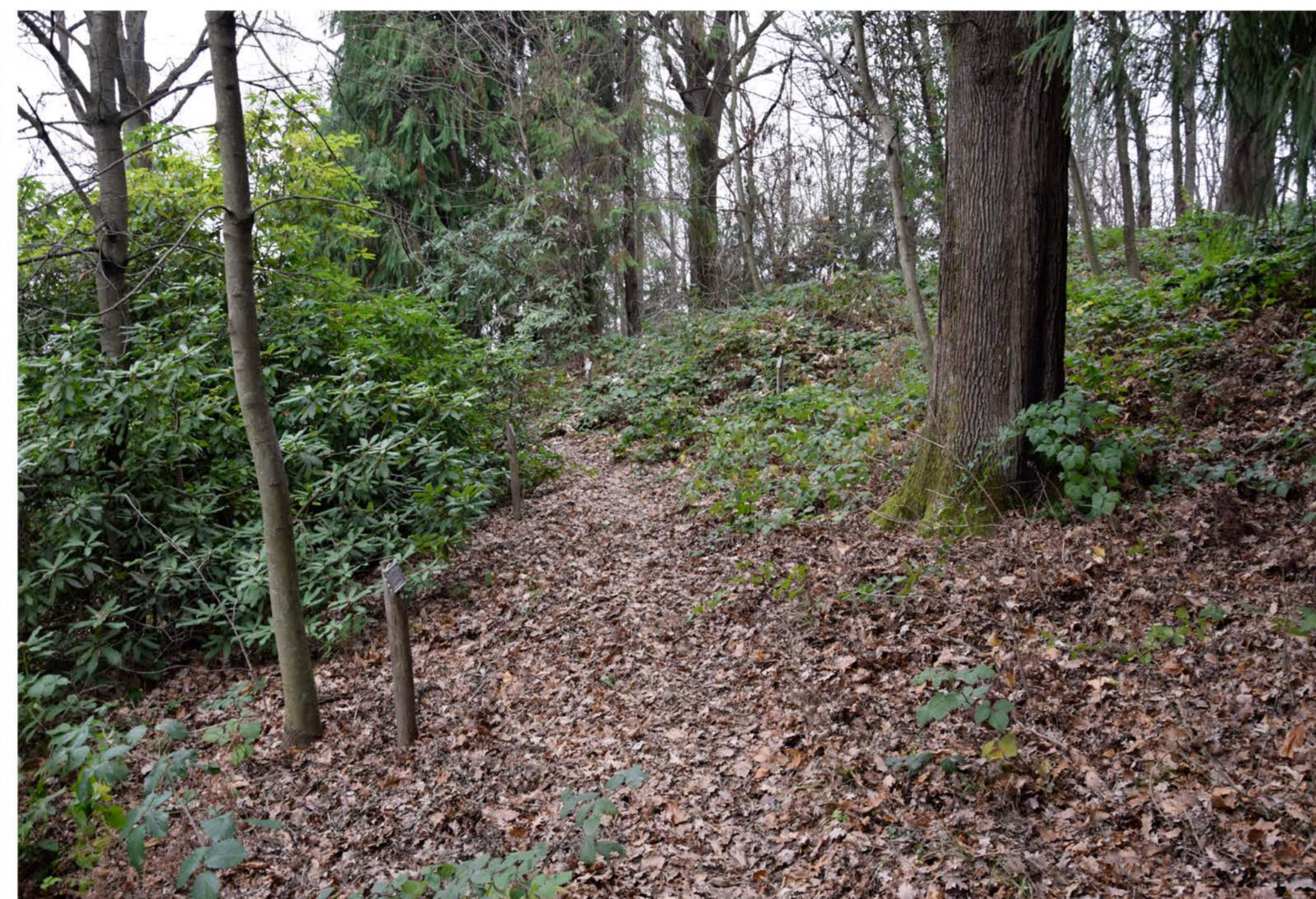
2- Viale Sabotino. Secondo tratto