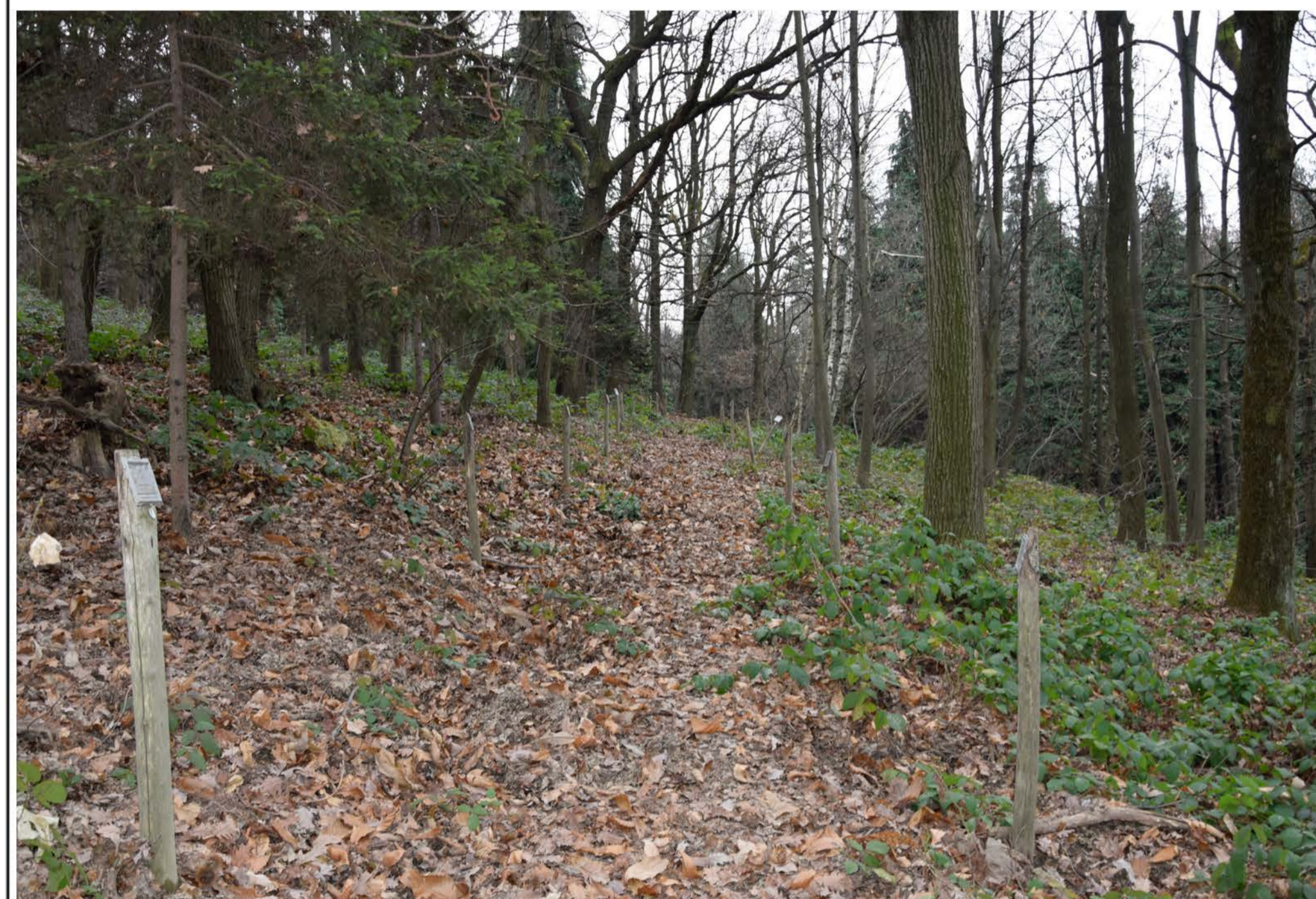
1- Viale Sabotino. Punto iniziale