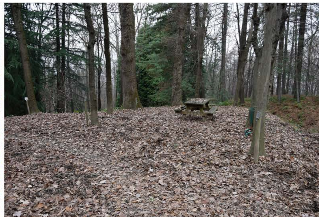
2- Viale Santa Lucia di Tolmino. Punto mediano