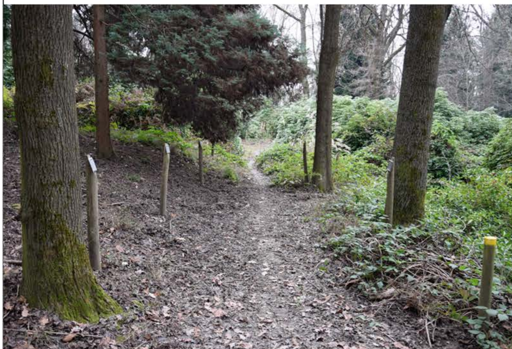
1- Viale Santa Lucia di Tolmino. Punto iniziale