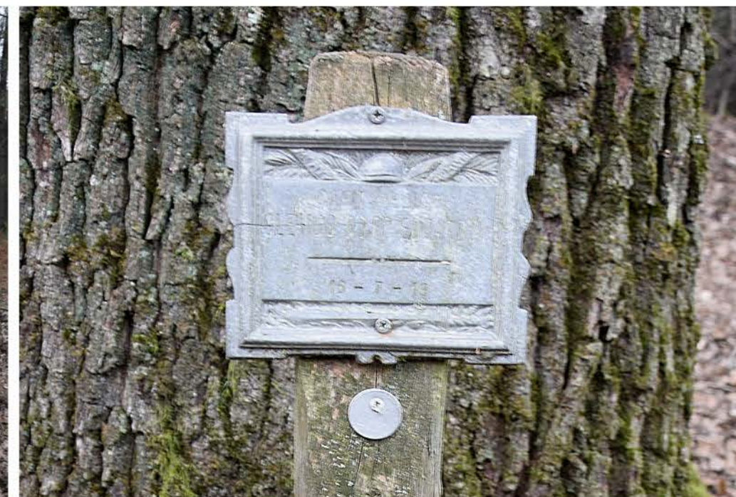
3 - Viale Santa Lucia di Tolmino. Cippo commemorativo Capitano CLERICO EDOARDO 16-7-19. matricola 4720