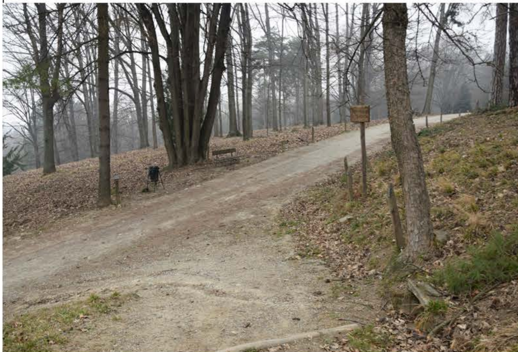
1- Viale Trincea delle Frasche. Punto iniziale