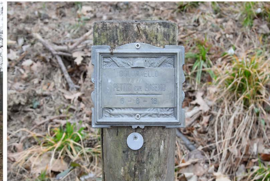
3 - Viale Trincea delle Frasche. Cippo commemorativo. Colonnello PETTITI cav. EUGENIO 6-8-16. matricola 1811