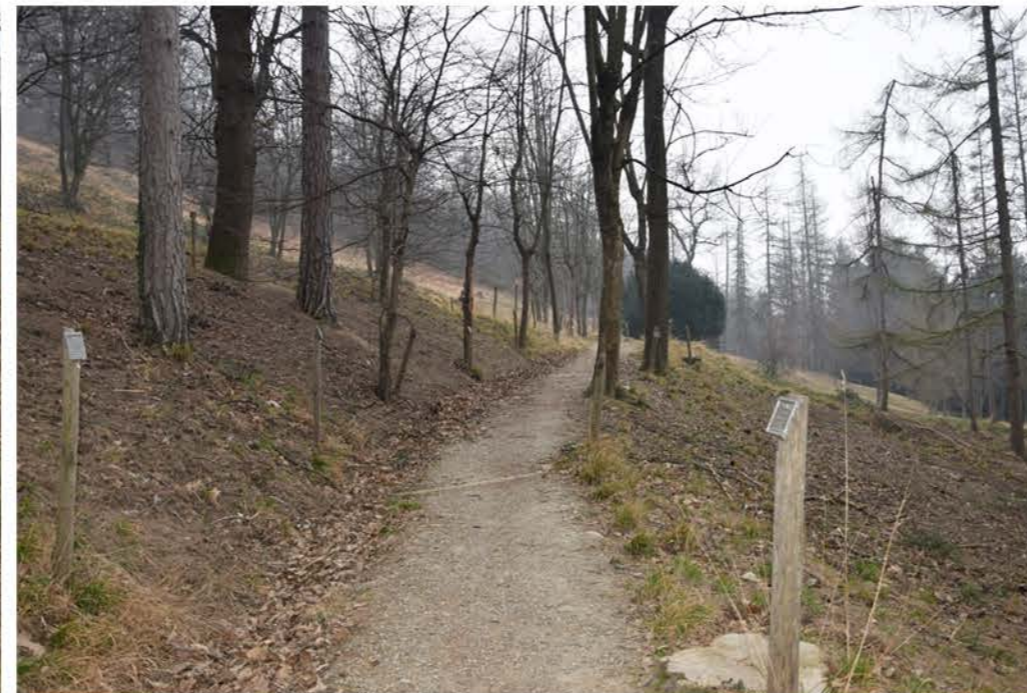
2- Viale Trincea delle Frasche. Tracciato