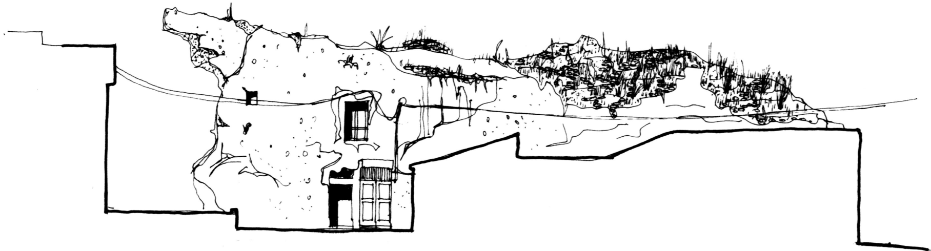
PROSPETTO VIA NAZIONALE