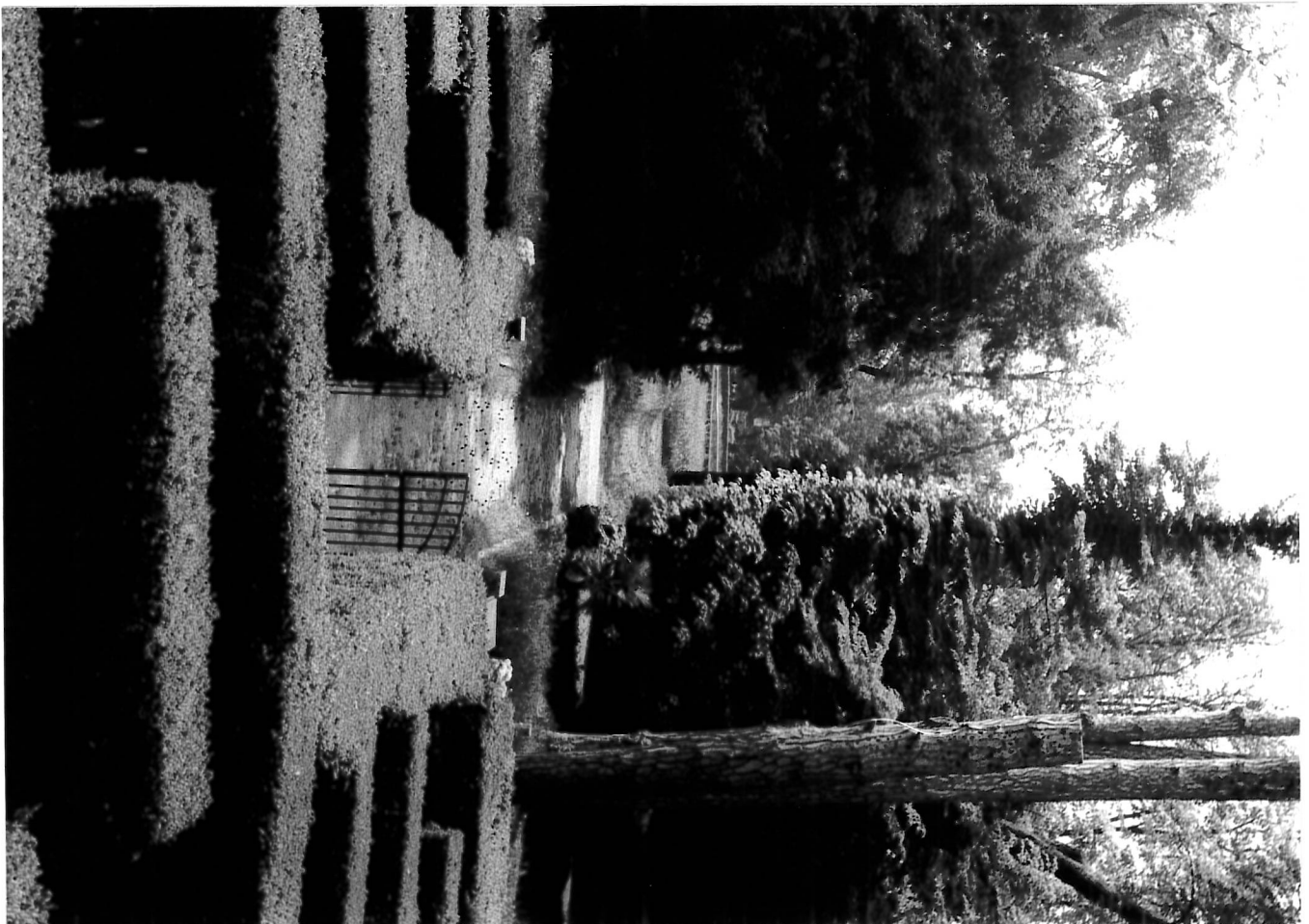
All. 5 - Vista dal Labirinto verso il Giardino