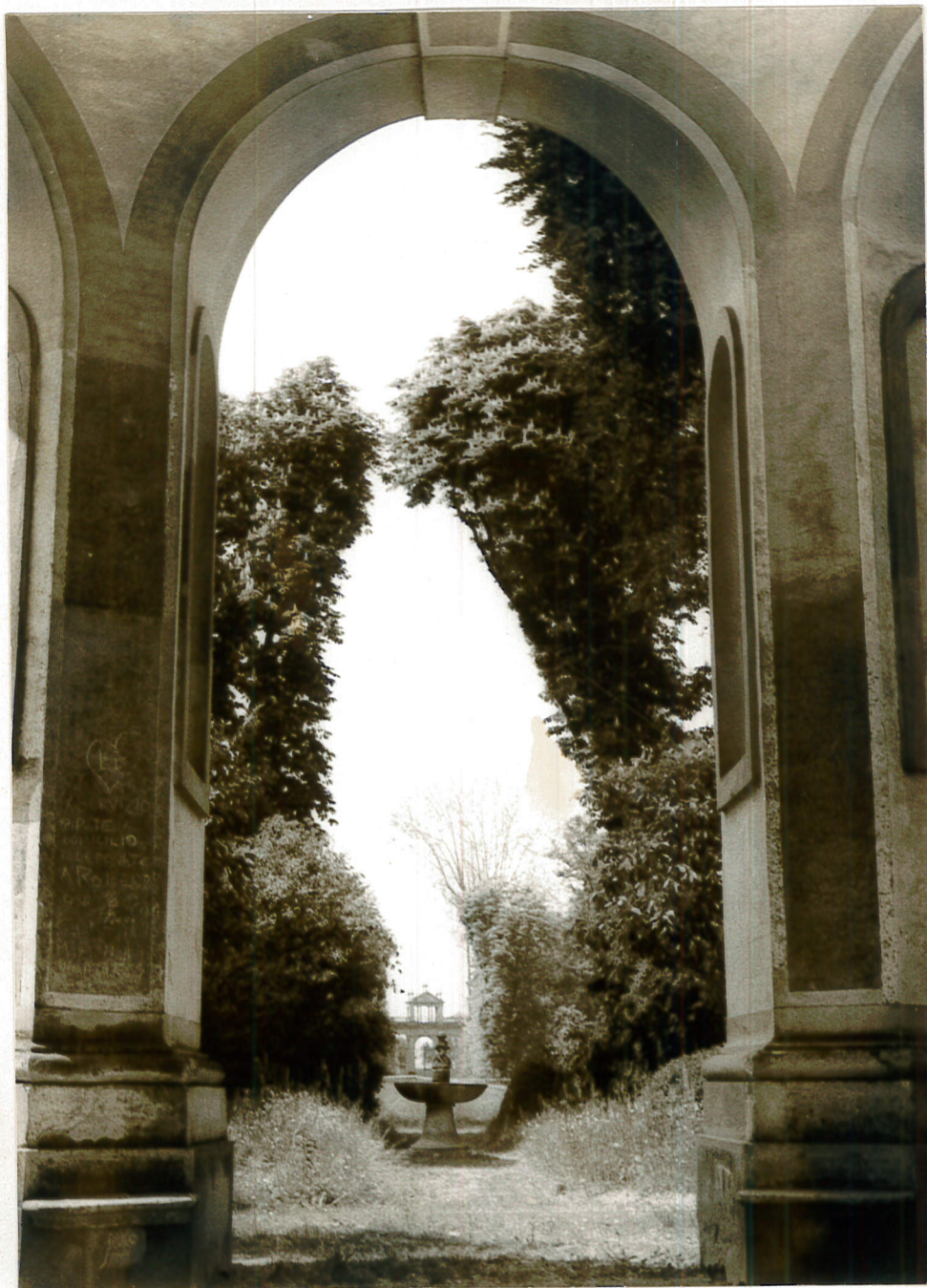
All. 2 - Vista dall'esda verso il Belvedere