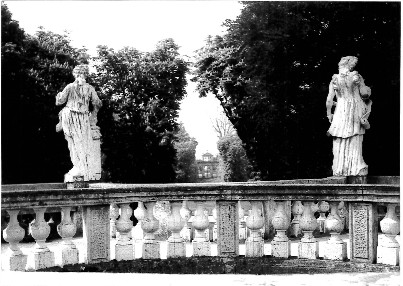
-All. 3 - "Cannocchiale prospettico" dall'esda verso il Belvedere