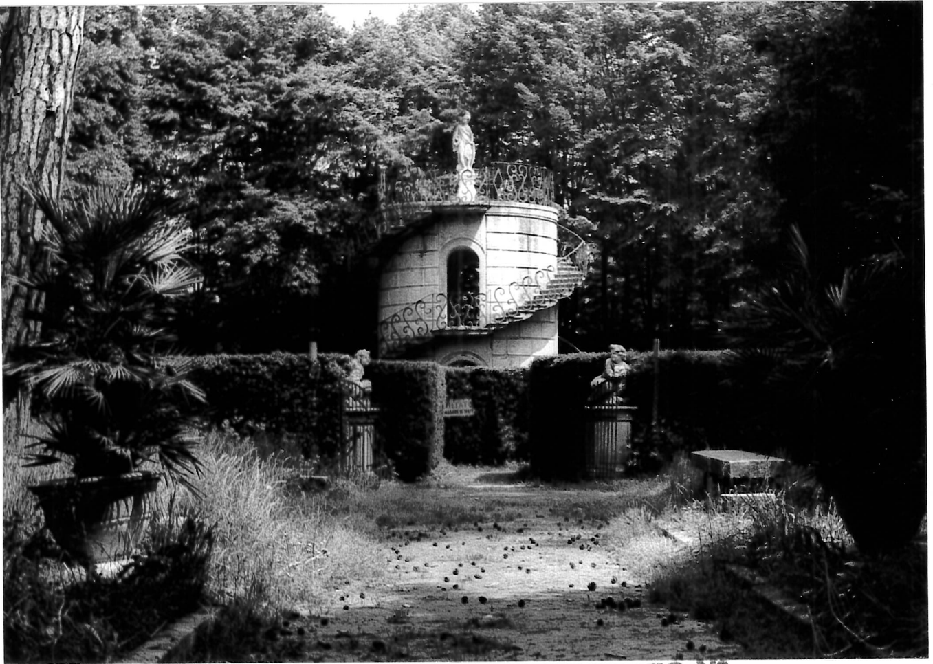
All. 4 - La torre del Labirinto AFSBAA VENETO N° 54051