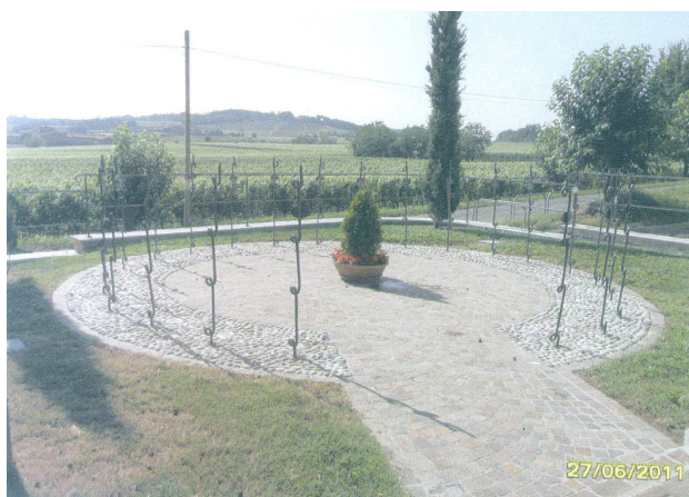
Vista dell'area dedicata ai Caduti, con le targhe commemorative disposte lungo il perimetro

COMUNE DI Adro PROVINCIA BS INDIRIZZO via San Pietro (davanti al cimitero) FRAZIONE/LOCALITA' Torbiano MONUMENTO N. 4/4