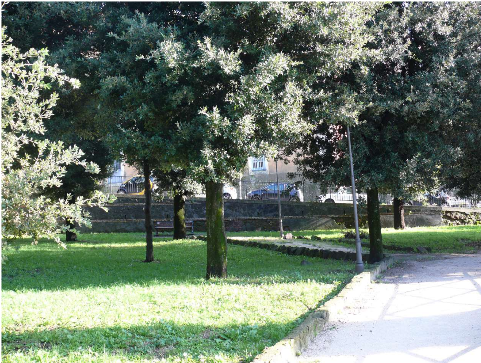
Foto 8 Vialetti di accesso