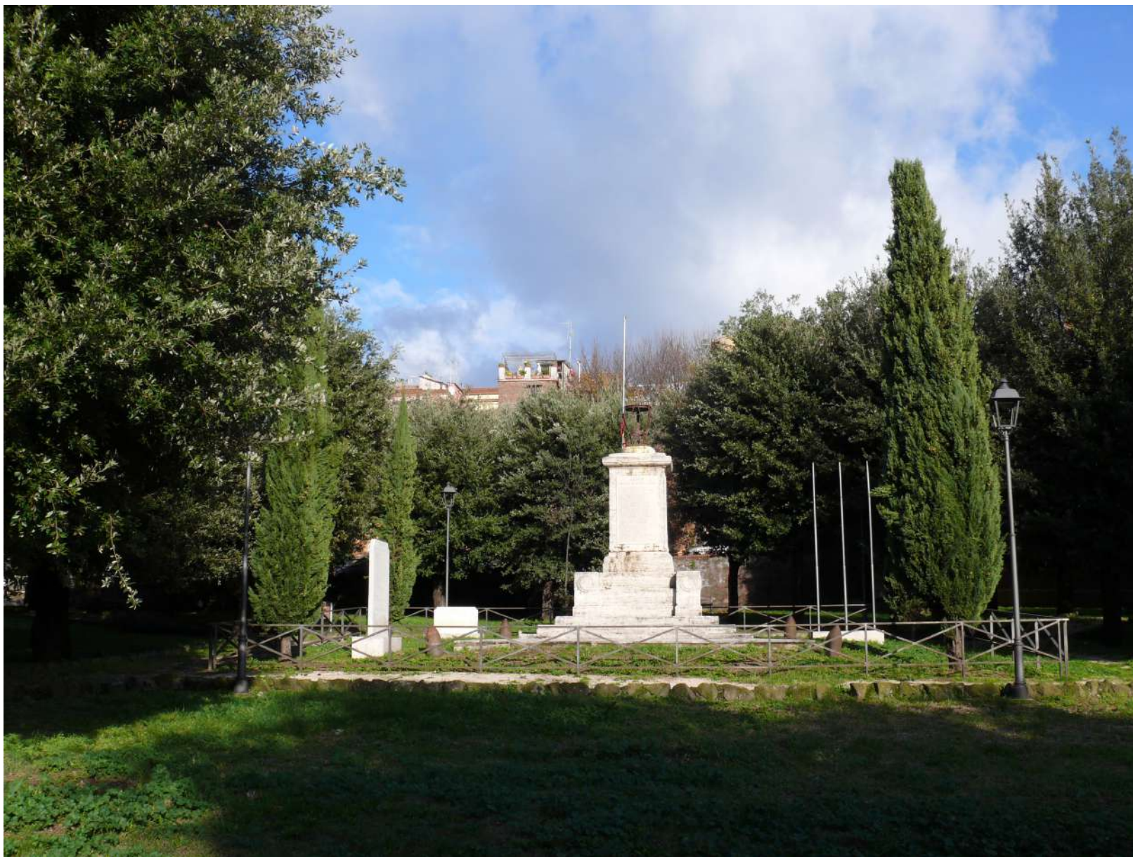
Foto 5 Monumento ai caduti