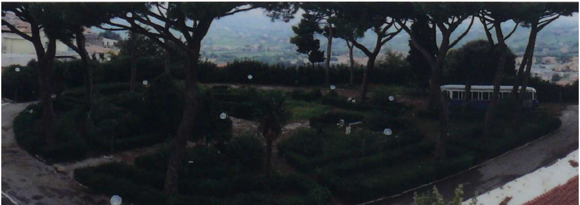
Fotografie storiche del parco prima della riqualificazioe dell'area