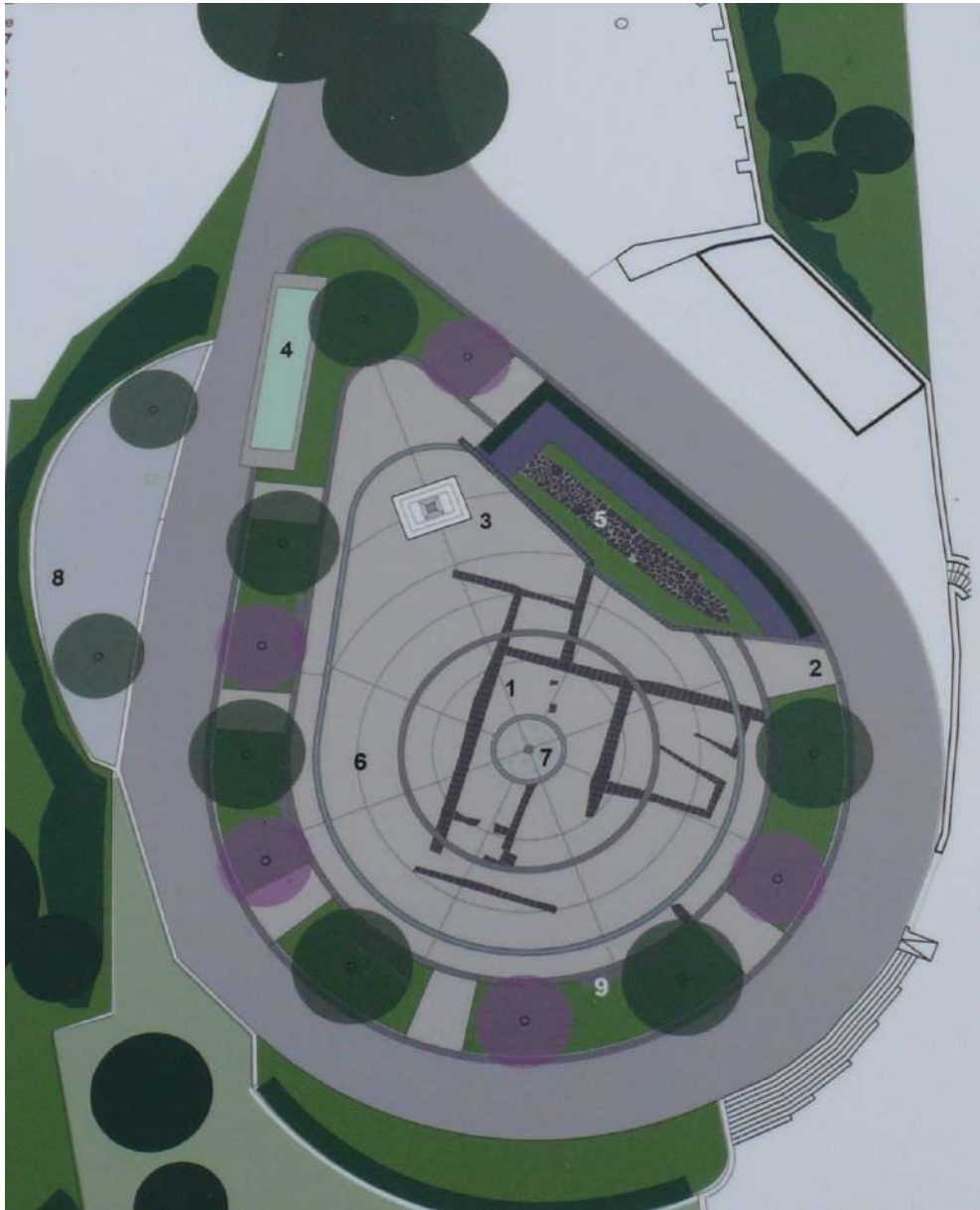
Progetto di riqualificazione della piazza a cura degli Arch. Pulcini e Silvestro e dell'Ing. Pizzol