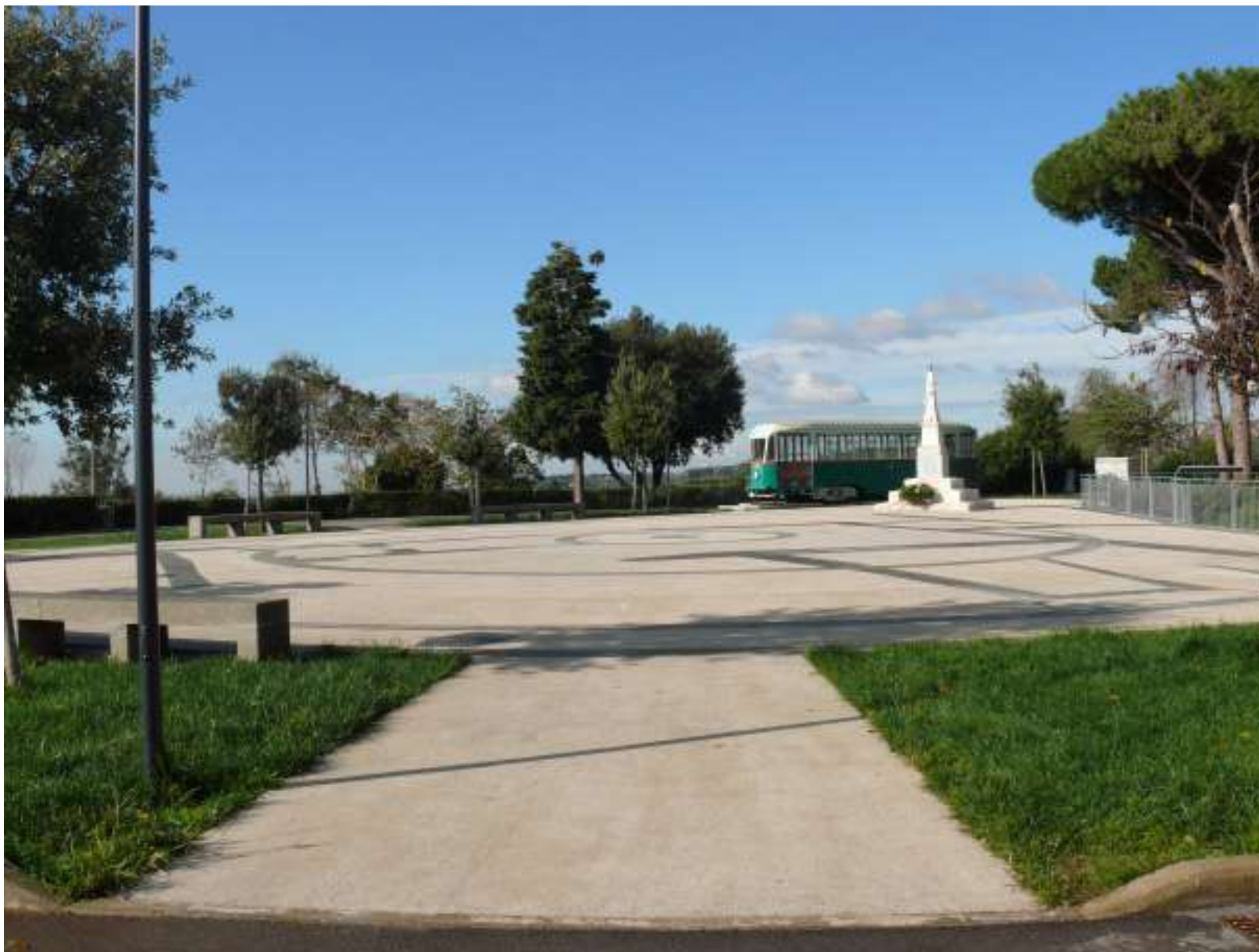
Foto 2 Vista della piazza