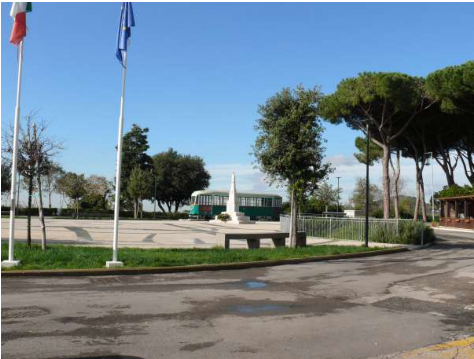
Foto 5 Vista del parco