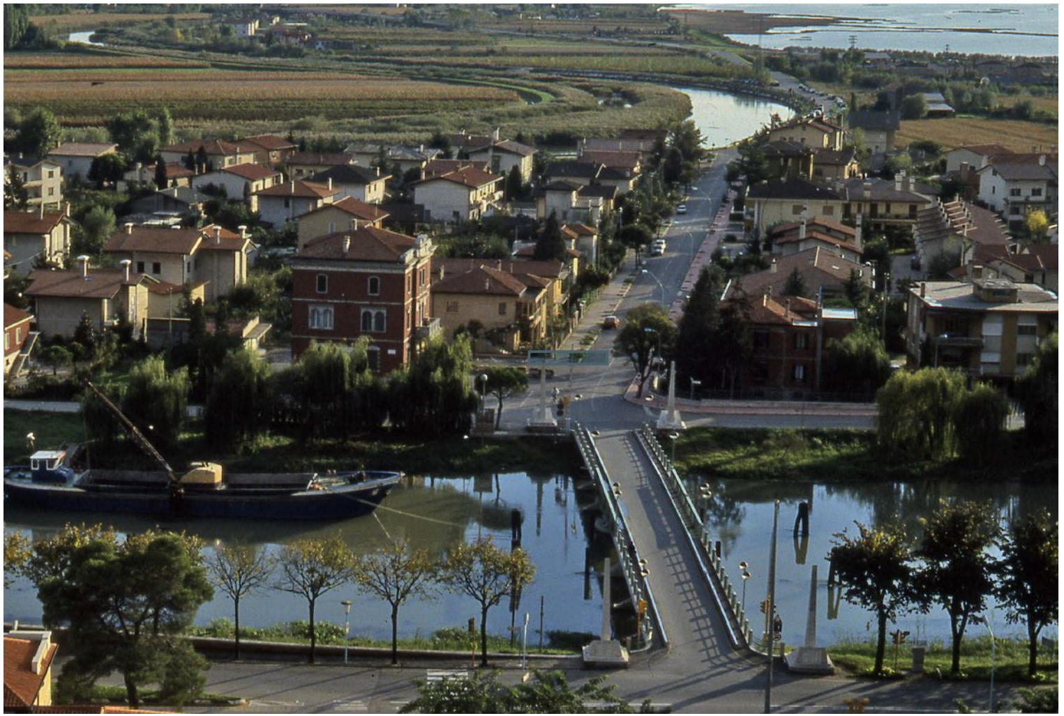
Jesolo. Via parco della Rimembranza, seconda metà anni '80. Il ponte e il Municipio. Da N.