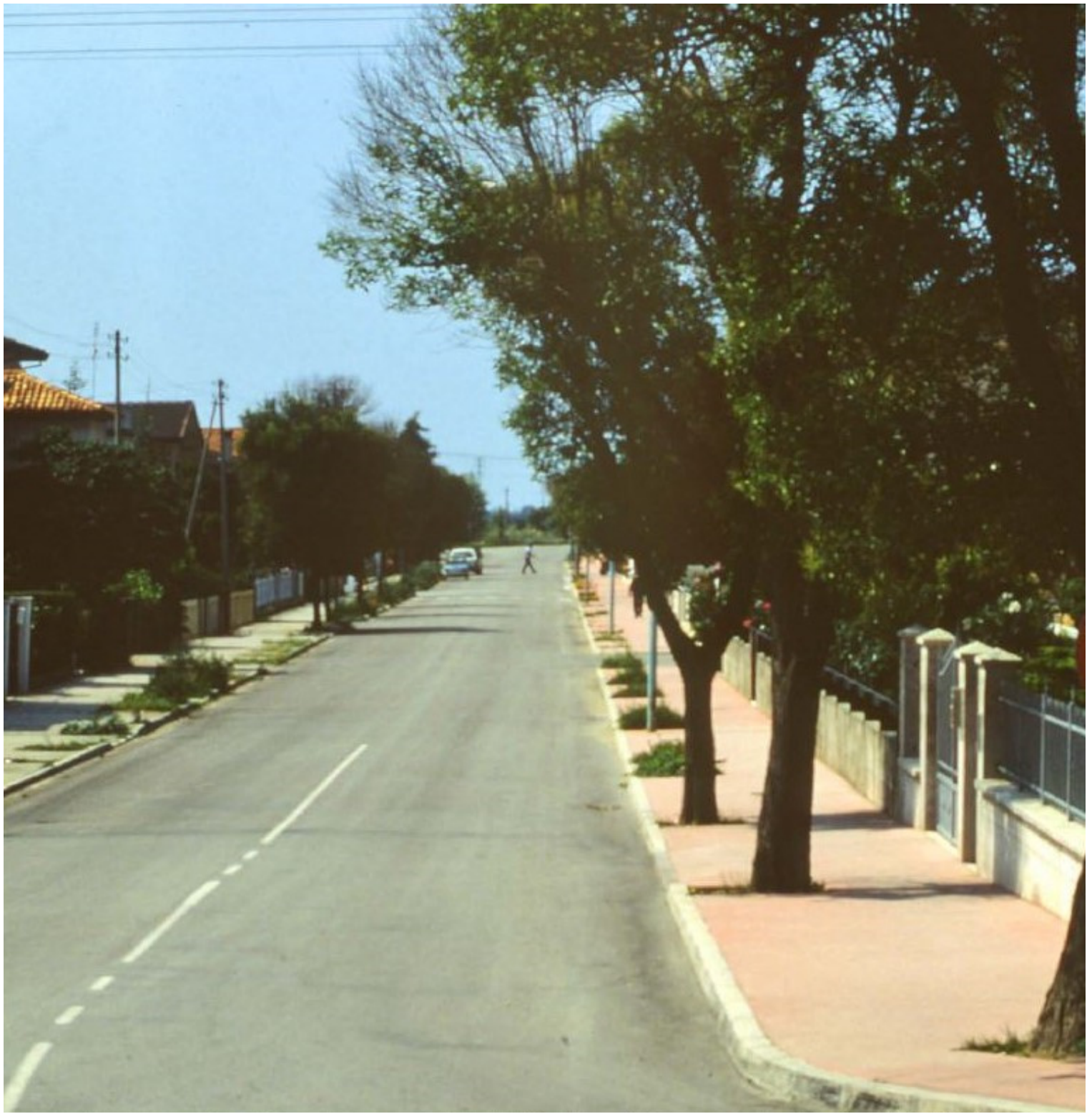
Jesolo. Via parco della Rimembranza, anni 1985-86. I ligustri giapponesi decimati dal freddo dell'inverno 1984-85. Archivio storico di Giuseppe Artesi Jesolo