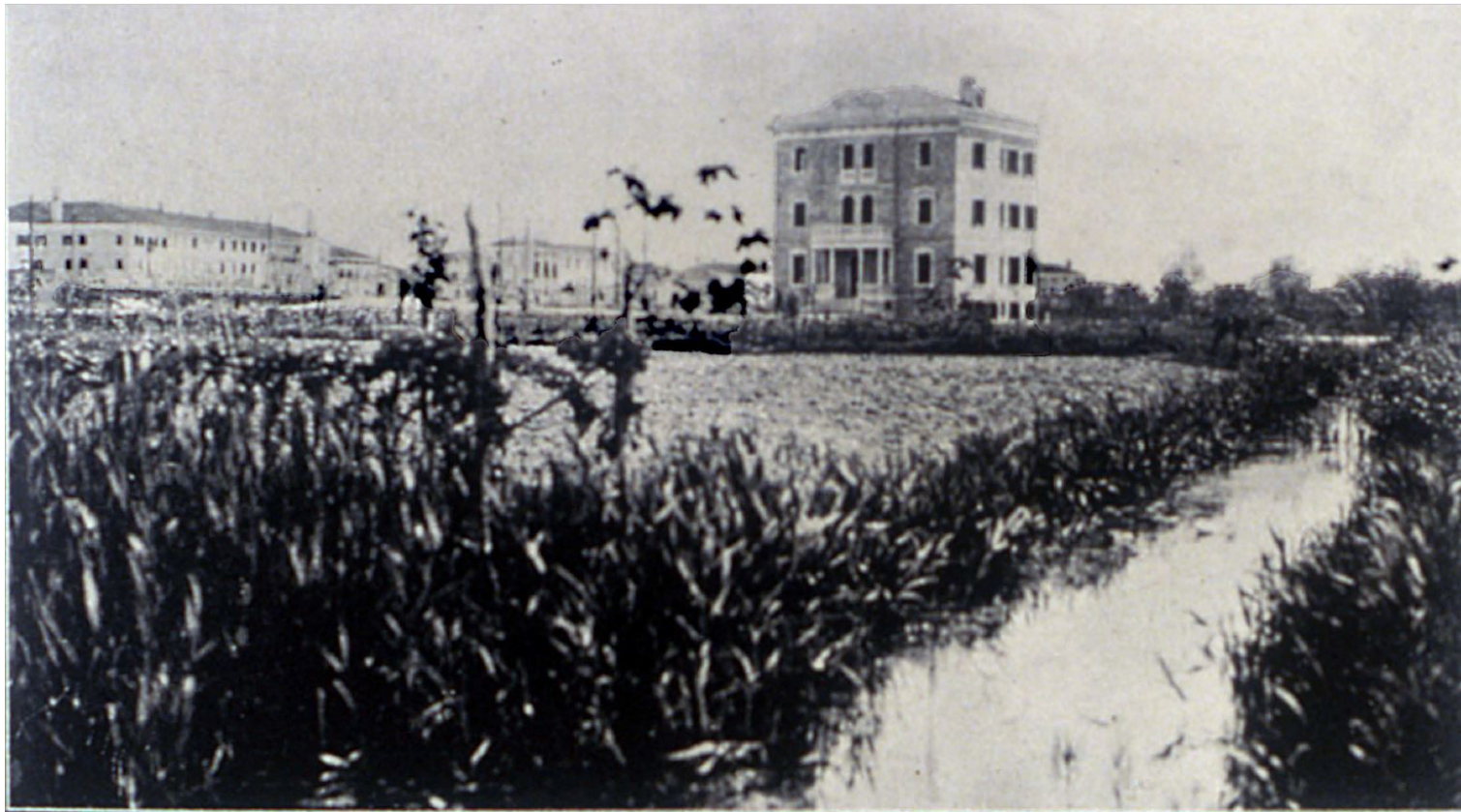
Jesolo. In primo piano il fosso anofeligeno, sullo sfondo, il ponte della Vittoria con gli obelischi sulla sinistra, l'ex casa del Fascio e sulla destra l'alberata di recente piantumazione di via Parco della Rimembranza.