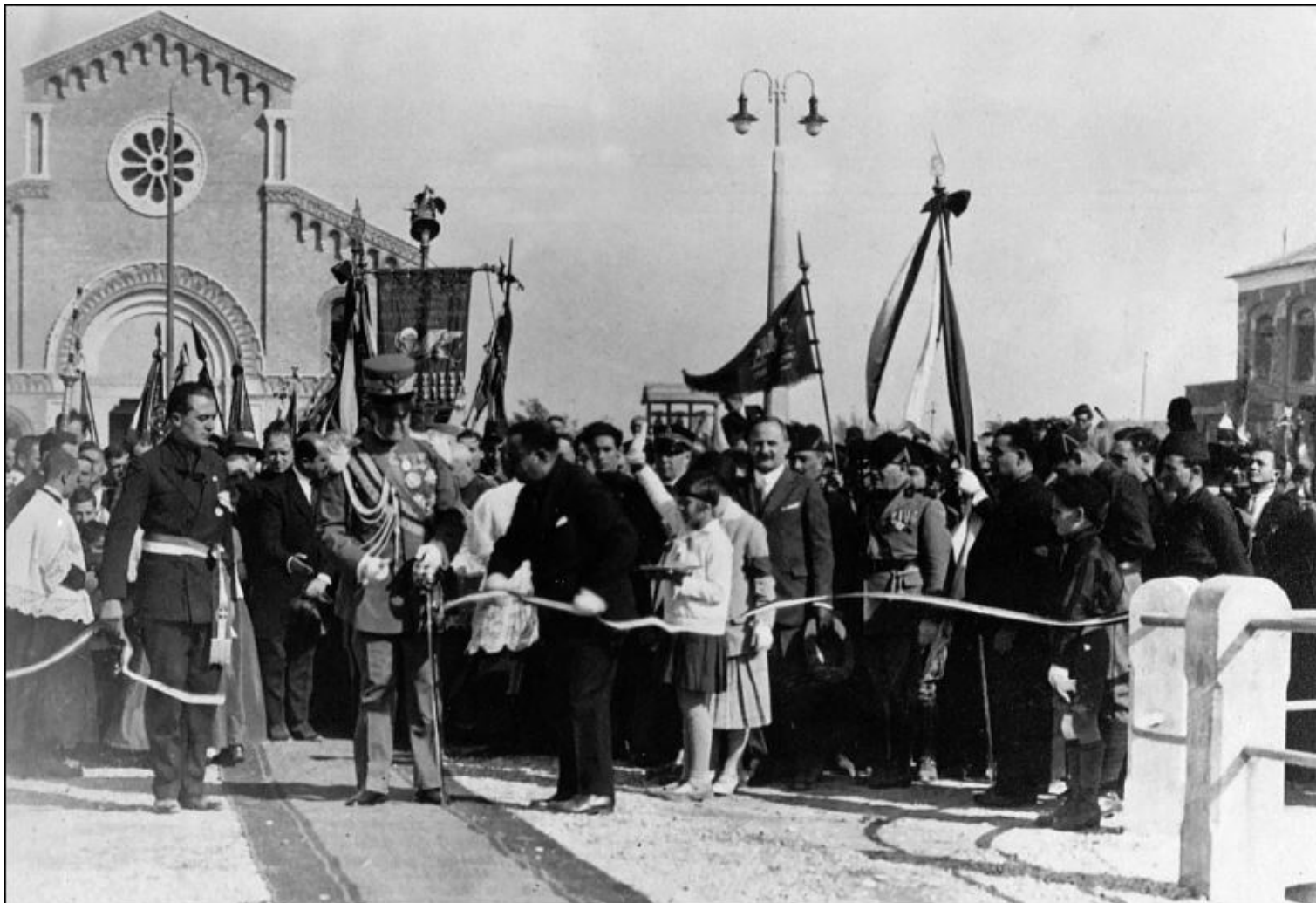
9.10.1927 Il Duca D'Aosta inaugura il Ponte della Vittoria

Jesolo. Inaugurazione del ponte della Vittoria. 09.10.1927.