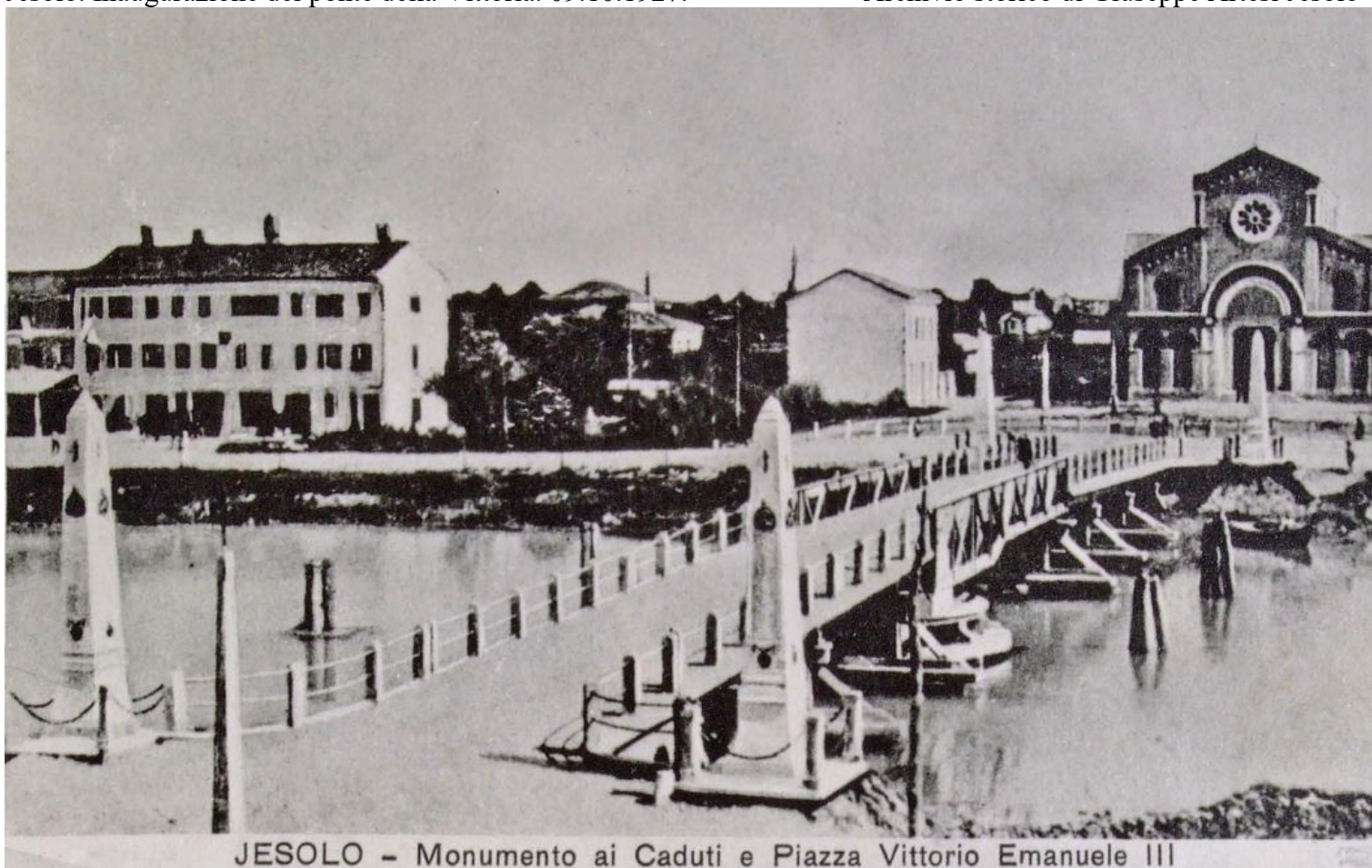
JESOLO - Monumento ai Caduti e Piazza Vittorio Emanuele III

Archivio storico di Giuseppe Artesi Jesolo