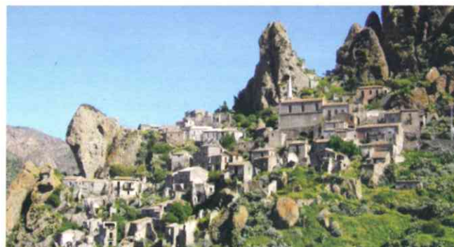
Il borgo di Pentedattilo

Vi si giunge da Melito attraverso una strada in salita ed è inserito nella visita ai luoghi dove visse S. Gaetano Catanoso.