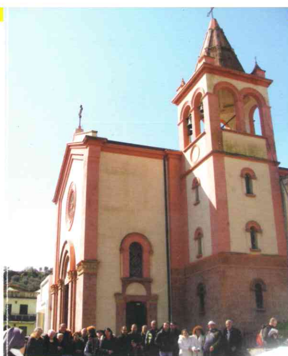
Chiesa Parrocchiale "S. Pasquale Baylon"

SUORE VERONICHE CHORIO DI SAN LORENZO Tel. 0965.720004 e-mail: suoreveronichevolto@yahoo.it