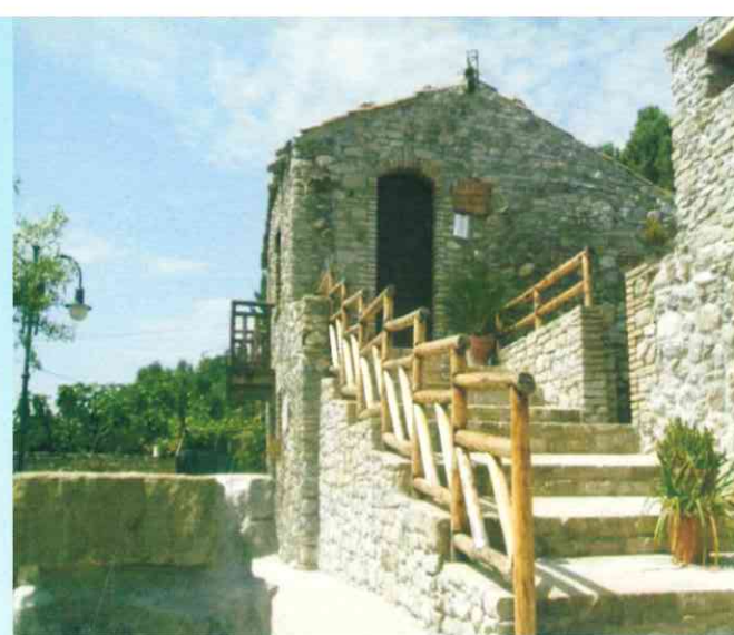
Foto casa natia di S. Gaetano

L'opera più importante da Lui compiuta fu la fondazione della Congregazione delle Suore Veroniche del Volto Santo , il 2 dicembre 1934, con il Carisma di riparare le offese umane visibili nel Volto Santo di Cristo dolente. Volle le sue Figlie presenti tra la gente più umile dei paesi remoti dell'Aspromonte, raggiungibili per lo più soltanto a piedi, per educare nelle Scuole per l'infanzia, per insegnare il Catechismo e per curare il decoro delle Chiese.