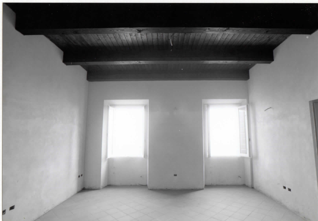
AMBIENTE AL PIANO PRIMO