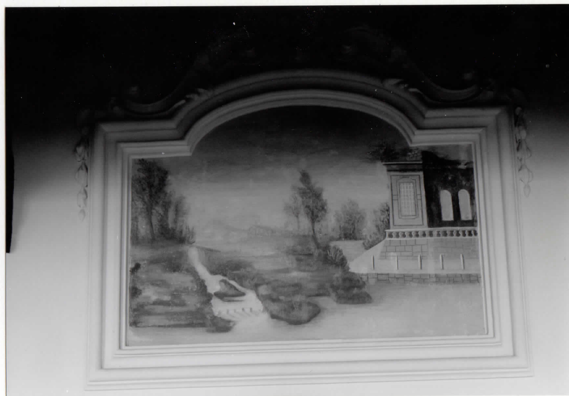
PARAMENTO DIPINTO E CORNICE IN STUCCO