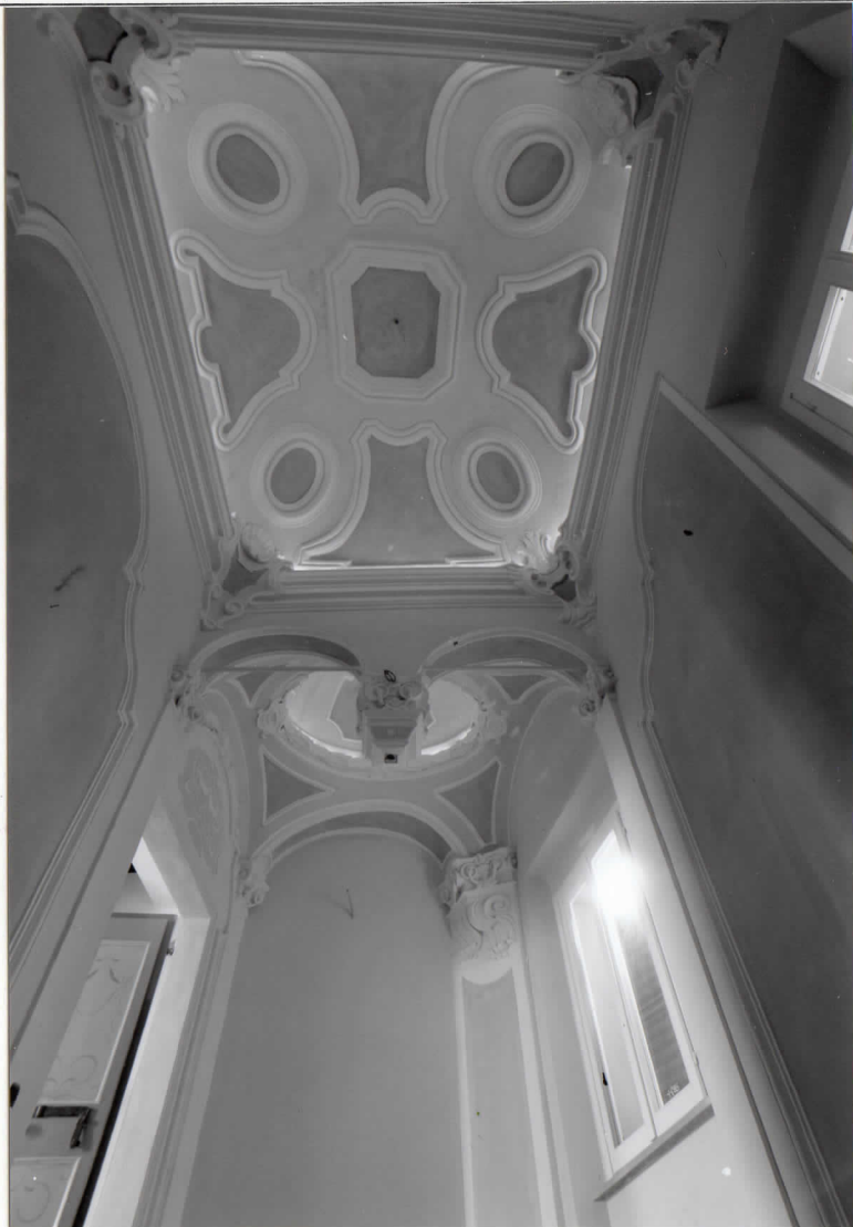
VANO SCALA - PARTICOLARE DEL SOFFITTO

ALLEGATO N. 2 SBAA RA 122794/93 (FO) BERTINORO, CASA PAGNONI, VIA MAZZINI 11