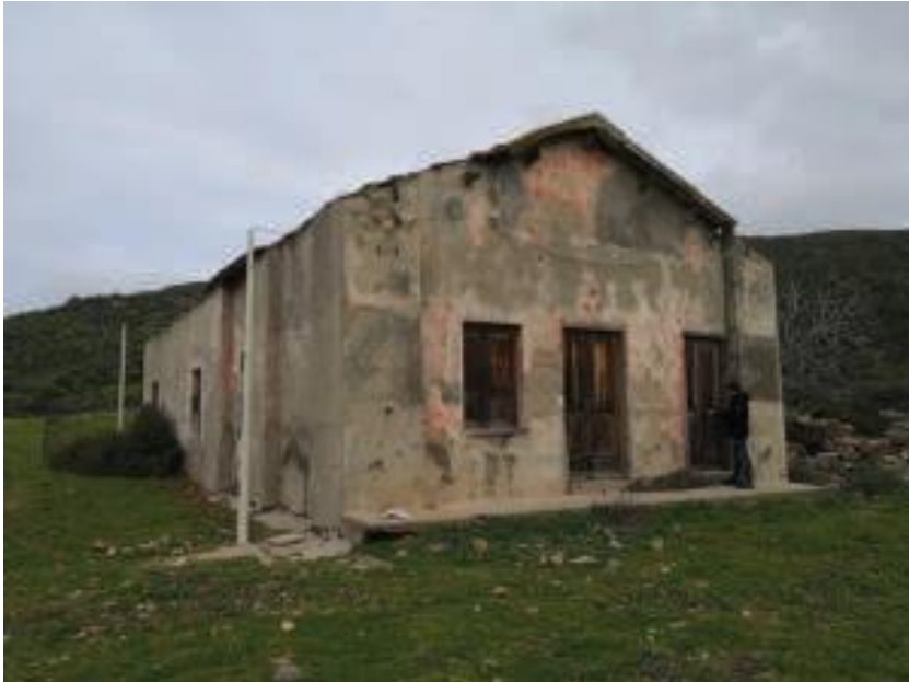
Immobile denominato “Ex Caserma Guardia di Finanza” a Cala Reale nell’Isola dell’Asinara: fronte d’accesso sul lato strada

DIREZIONE GENERALE ARCHEOLOGIA, BELLE ARTI E PAESAGGIO SOPRINTENDENZA ARCHEOLOGIA, BELLE ARTI E PAESAGGIO PER LE PROVINCE DI SASSARI E NUORO