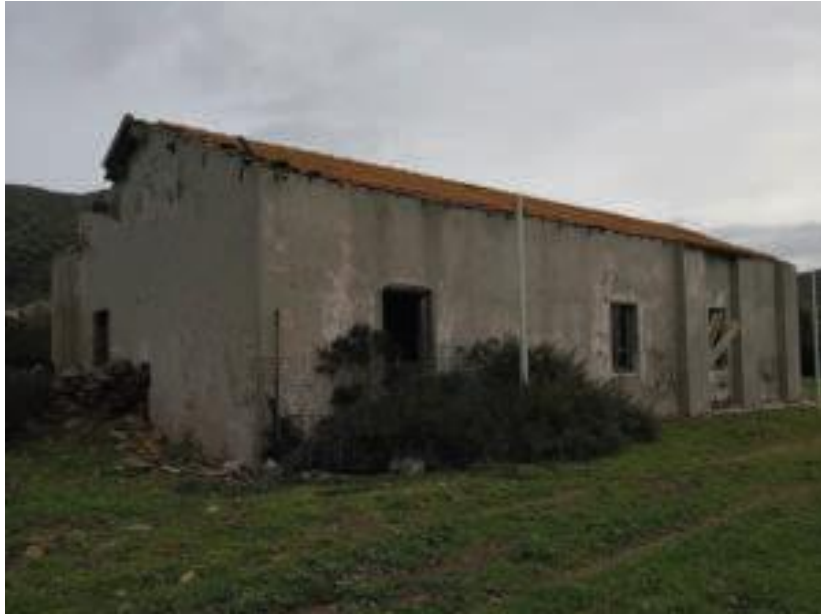
Immobile denominato "Ex Caserma Guardia di Finanza" a Cala Reale nell'Isola dell'Asinara: sviluppo longitudinale da tergo

DIREZIONE GENERALE ARCHEOLOGIA, BELLE ARTI E PAESAGGIO SOPRINTENDENZA ARCHEOLOGIA, BELLE ARTI E PAESAGGIO PER LE PROVINCE DI SASSARI E NUORO