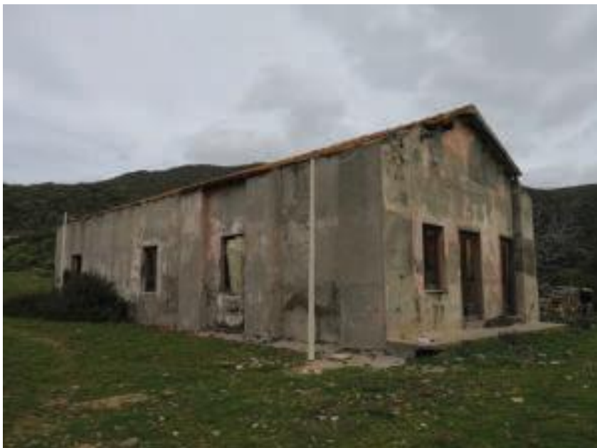
Immobile denominato “Ex Caserma Guardia di Finanza” a Cala Reale nell’Isola dell’Asinara: fronte d’accesso sul lato strada e sviluppo longitudinale