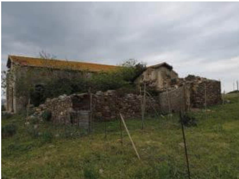
Immobile denominato "Ex Caserma Guardia di Finanza" a Cala Reale nell'Isola dell'Asinara: sviluppo longitudinale e braccio trasversale (cortile)