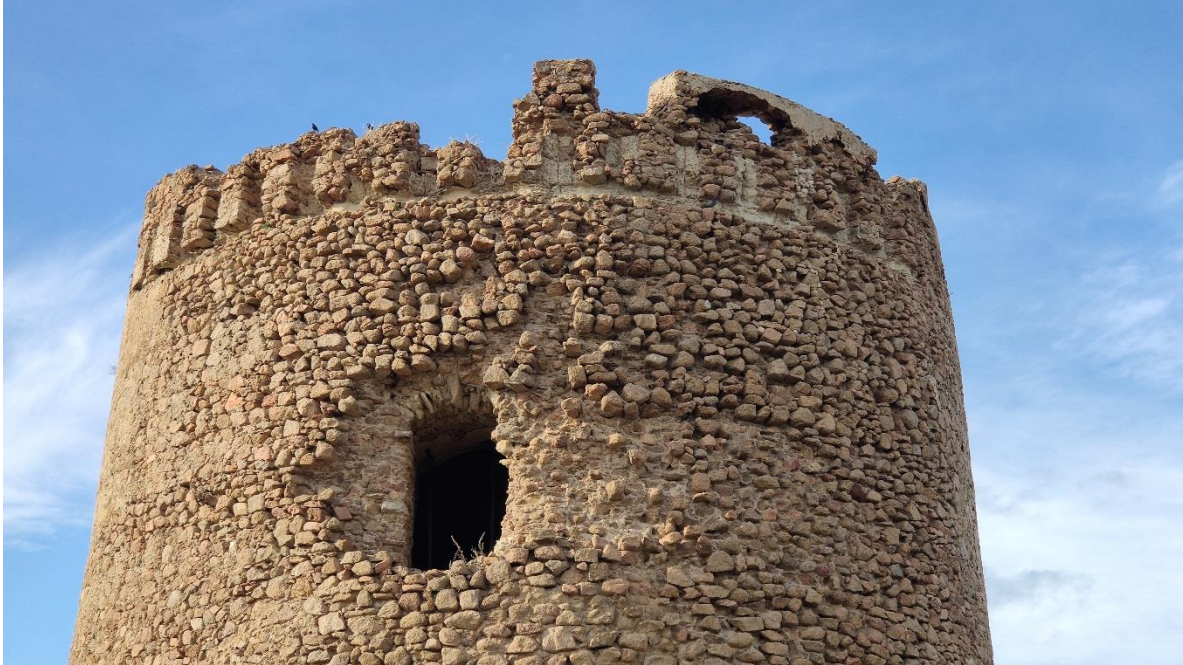
Particolare del coronamento, dell'accesso a sud e del degrado delle murature

DIREZIONE GENERALE ARCHEOLOGIA BELLE ARTI E PAESAGGIO SOPRINTENDENZA ARCHEOLOGIA BELLE ARTI E PAESAGGIO PER LE PROVINCE DI SASSARI E NUORO