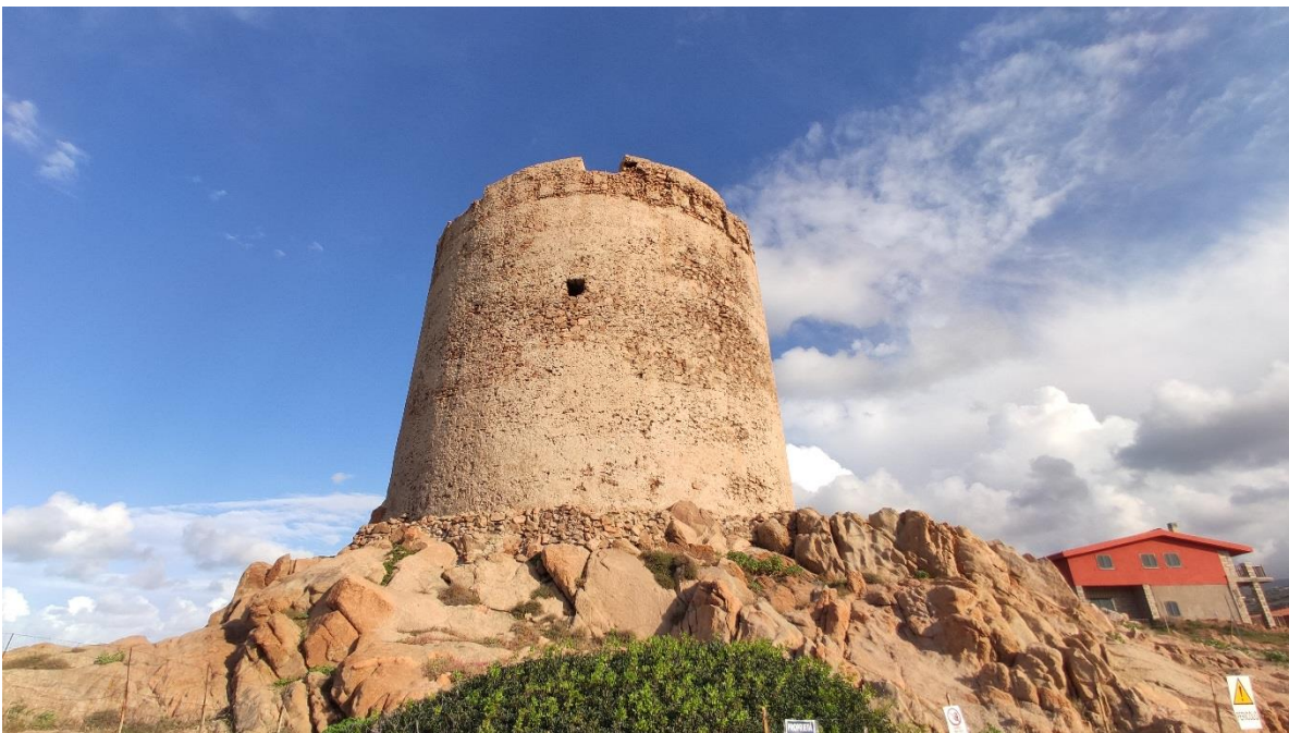
Vista dalla scogliera a nord