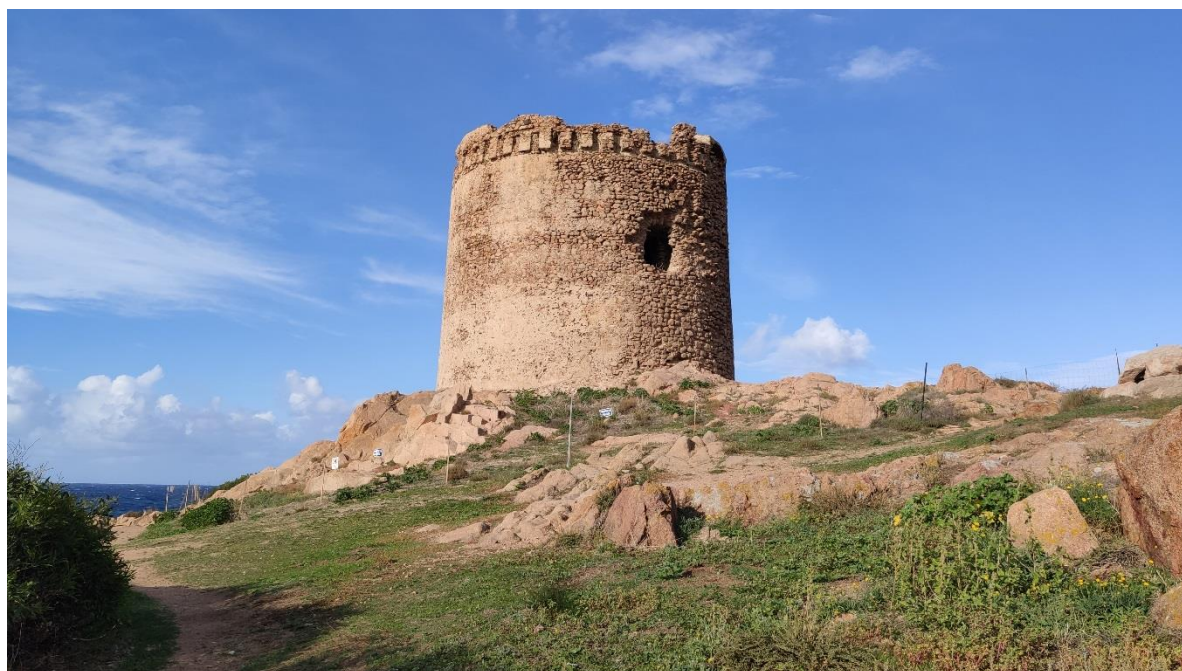
Vista dalla pubblica via a sud