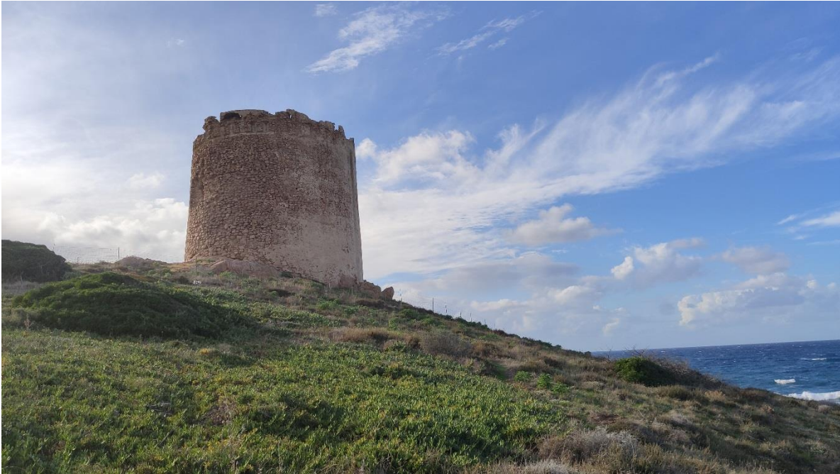
Vista dalla costa a est

DIREZIONE GENERALE ARCHEOLOGIA BELLE ARTI E PAESAGGIO SOPRINTENDENZA ARCHEOLOGIA BELLE ARTI E PAESAGGIO PER LE PROVINCE DI SASSARI E NUORO