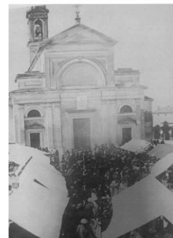
L'utilizzo collettivo della piazza durante le diverse manifestazioni e sagre cittadine (foto anni '30 del Novecento)

Negli anni successivi sono eseguiti interventi per la realizzazione di una nuova pavimentazione che però viene prevalentemente realizzata in conglomerato bituminoso.