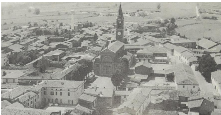
La piazza dopo la piantumazione dei filari di tigli (Anni '30 del Novecento)