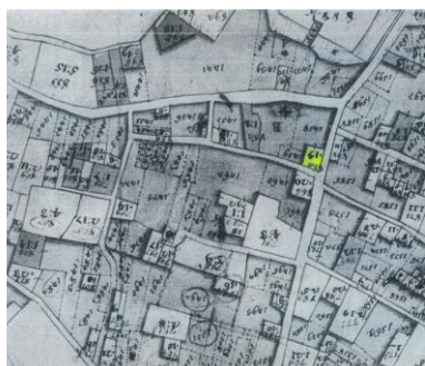
Catasto Lombardo Veneto

Prospettano sulla piazza gli edifici storici tra i più importanti del nucleo urbano, in particolare la Chiesa di Santa Maria Immacolata e il Municipio; la piazza venne probabilmente realizzata a partire dal 1859, in seguito alla costruzione della chiesa parrocchiale; infatti il 2 ottobre 1859 monsignor Antonio Novasconi, vescovo di Cremona, consacrava la chiesa parrocchiale dedicandola, oltre che ai patroni precedenti (San Biagio, Santa Giulia e San Bernardino) anche a Maria Immacolata; da allora la prima domenica di ottobre è diventata la "Festa della Dedicazione", oltre che sagra paesana.