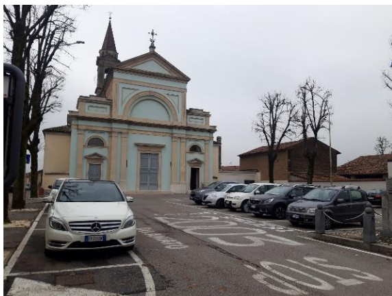
Scorci d'angolo dello spazio urbano