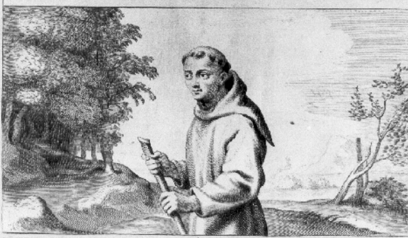
Delineatio tumuli Eleonorę a Sabaudia Anno 1296 extructi Villę Francę in agro Bellouacensi in quo plerique Fratres Minores extrema illi in morte perfoluatos circumstant. Inferius conspicitur Fratris Minoris simulachrum quod in lapide natiuoreo exterioris Ecclesię S. Francisci vrbis Senensis facie extat factum Anno 1292