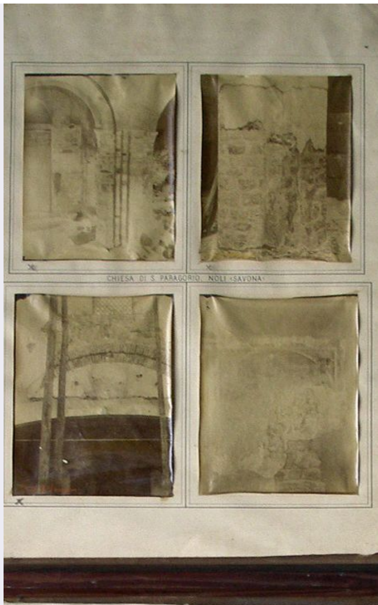
CHIESA DI S. PARAGORIO, NOLI (SAVONA)