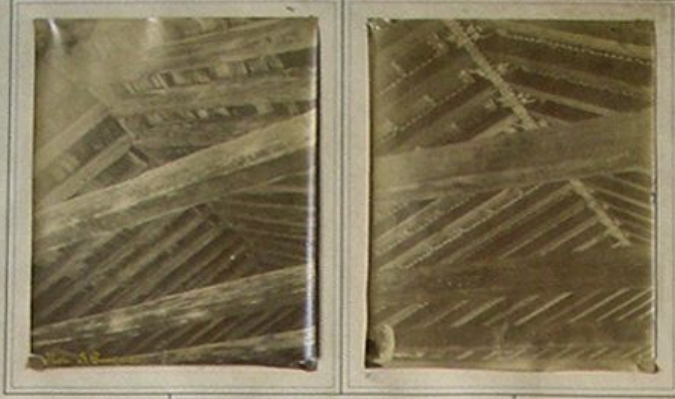
CHIESA DI S. PARAGORIO. NOLI (SAVONA)