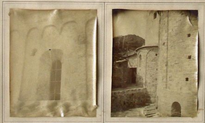
CHIESA DI S. PARAGORIO. NOLI (SAVONA)