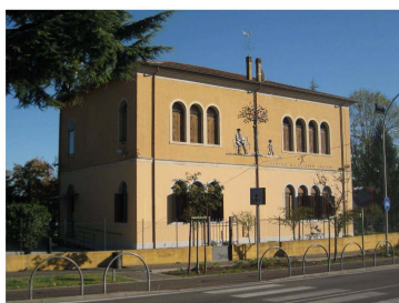
Foto 1. angolo nord-ovest.

PROSPETTI ESTERNI LUNGO VIA CLAUDIA, IN PROSSIMITA' DEL CENTRO STORICO.