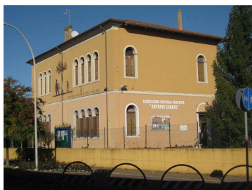
Foto 2. angolo sud-ovest