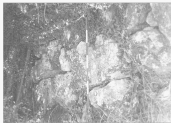
107. - Porta sud: muro sul lato sinistro dell'entrata (57a).