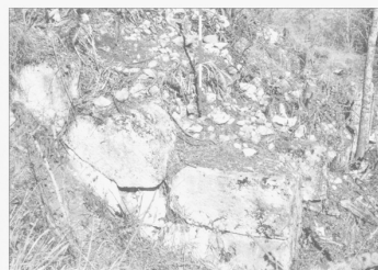
104. - Porta sud: angolo meridionale della torre.