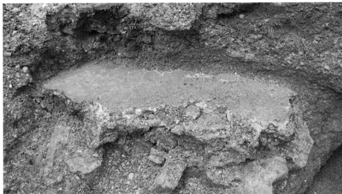
fig. 1 – Teramo. Via Porta Carrese: lacerto di pavimentazione.