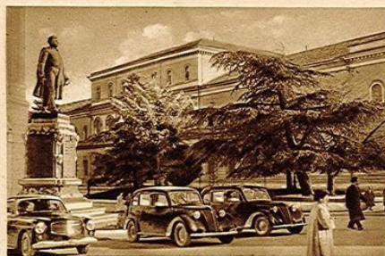
Facciata con giardino

CONVITTO NAZIONALE " MARIO PAGANO " .. CAMPOBASSO Via Mazzini, 1 - Tel. 3118