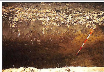
Fig. 2. Giridello: la porzione occidentale della sezione est-ovest.