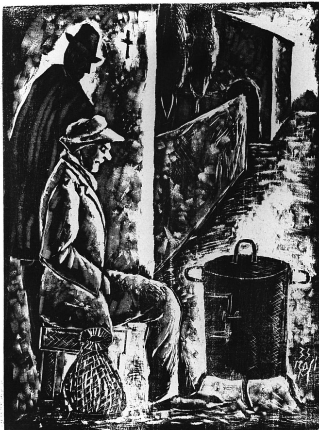
Il venditore di bruciate