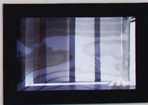
FOTOGRAFIE DEL MODELLO DI STUDIO