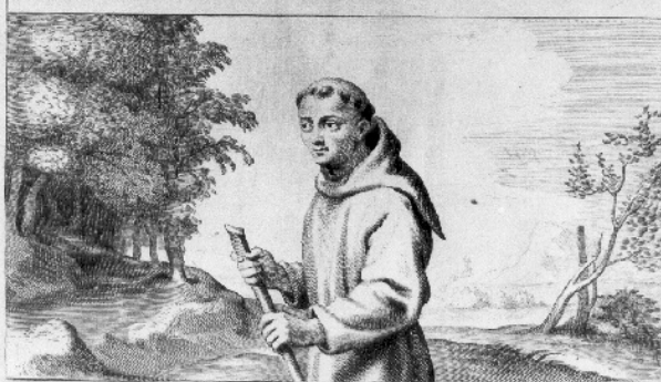
Delineatio tumuli Eleonoræ a Sabaudia Anno 1296 extructi Villæ Francæ in agro Bellouacensi in quo plerique Fratres Minores extrema illi in morte perfoluentes circumstant. Inferius conspicitur Fratris Minoris simulacrum quod in lapide natiuitatis exterioris Ecclesiæ S. Francisci vrbis Senensis facie extat factum Anno 1292