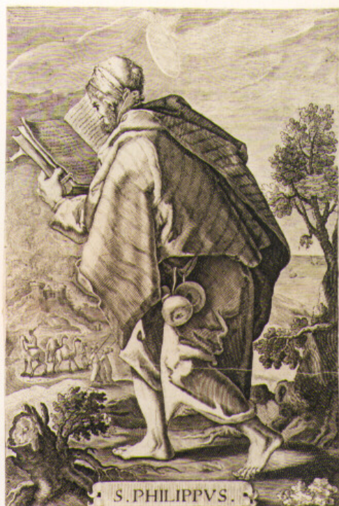
S. PHILIPPVS. INDE VENTVRVS EST IVDICARE VIVOS ET MORTVOS. 1728 Marco Sadeler sculpit.