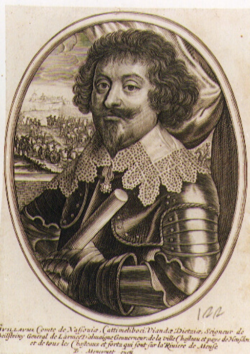
JVILLAVRUE Comte de Nafouze, Catinelboci, Viandier, Dietator, Seigneur de Bailley General de L'armée, aluaigne Gouverneur de la ville Chyloau et pays de Noyon, et de tous les Chyloaus et forta qui font sur la Riviere de Menje D. Moncomet - excu