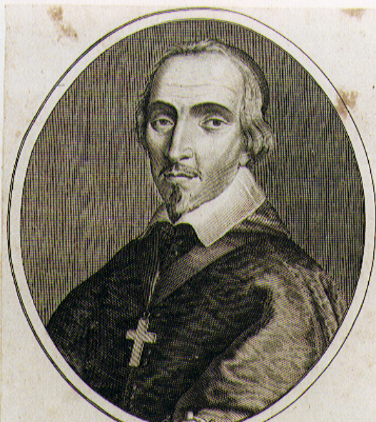
JEAN BAPTISTE GAULT