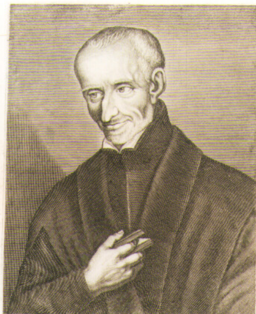
P. Dionysius Petavius Aurelianensis e societate Iesu obijt Parisijs die xi. Decembris. An. 1652. ætatis suæ 70. M. de la. fuit. Ansdan. gœc. com. privilège.