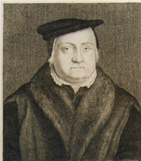
MARTINVS LV THERVS Theologus 1202 Natus Iſlebie anno 1483. obiit in patria anno 1546. Wigſius Hollar fecit. Jan. Meyſſens exc. Antwerp.