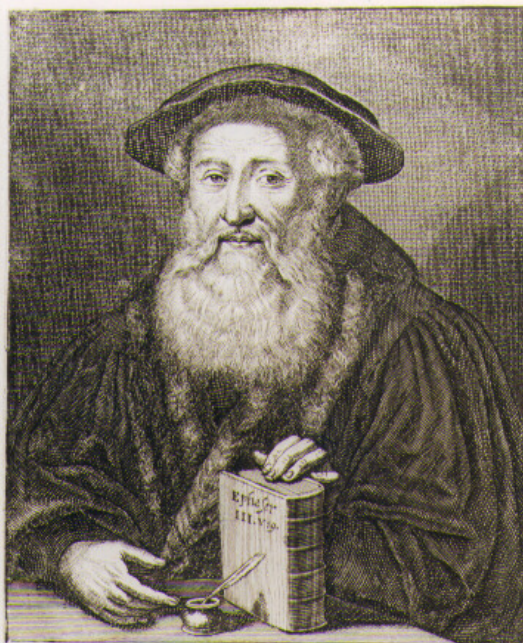
THEODORUS BIBLIANDER, NATUS EPISCOPICELLA HELVETIORUM. A: 1504. IN PROFESSIONE THEOLOGICA ZUINGLIJ SUCCESSOR A: 1532. Denatus A: 1564. Et docui totum, et toto cognoscor in orbe, Linguarum cultor, Theologusq; fui.